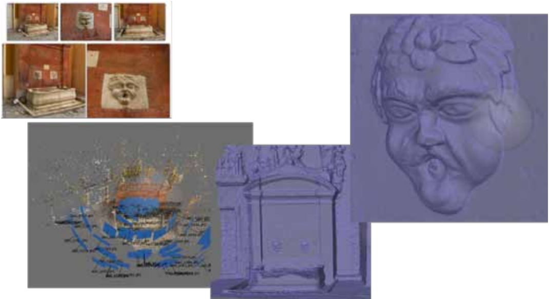
Figura 5: Proceso de trabajo para fotogrametría y modelado 3D

Fuente de Calle Cristo (Málaga). Elaboración propia.