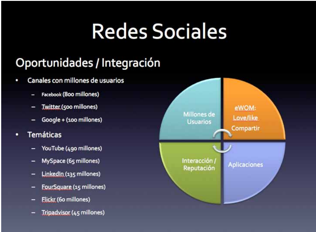
Figura 4: Usuarios en redes sociales