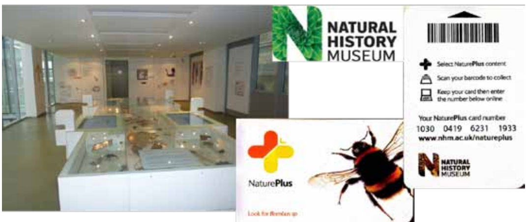
Figura 6: Tarjeta NaturePlus (Natural History Museum – Londres)

Otro interesante caso, es el uso de códigos de barra o códigos QR que encontramos en NaturePlus del Natural History Museum (Londres), que consiste en una tarjeta de cartón con un código de barras incorporado que dotan al usuario de una experiencia nueva en su visita al museo. Es un sistema simple, tras darse de alta el usuario en la web del museo y, a medida que se va pasando el código de barras por cada uno de los elementos de interés, se va almacenando (en un sitio web) información adicional de los recursos seleccionados. Pero, detrás de todo esto, se esconde un sistema CRM que es capaz de registrar el perfil de los visitantes a esta sección del museo de historia natural (figura 6).