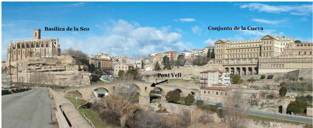
Figura 2: Vista monumental de Manresa y sus tres elementos característicos