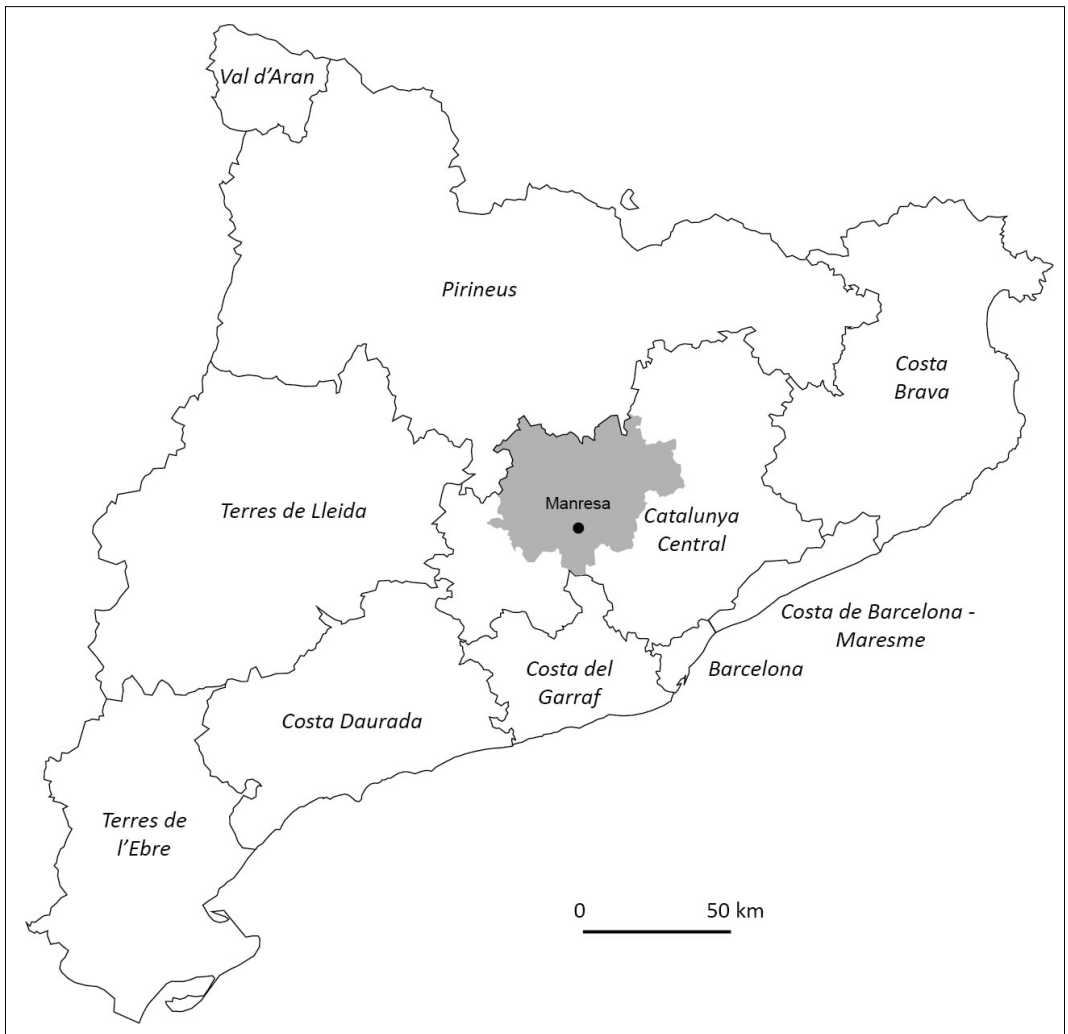
Figura 1: Manresa y el Bages en el contexto catalán y de las marcas turísticas

De entrada, la comarca parte de una situación en el mapa turístico catalán poco favorecedora puesto que en esta Comunidad el turismo se reparte, básicamente, entre el litoral y en menor medida la montaña, y pasa de largo por una gran parte de la Depresión Central, precisamente donde se ubica el Bages (figura 1). De hecho, y siguiendo la conocida tesis de Urry (1990) de la difusión de la “mirada turística”, el Bages ha estado apartado del proceso de especialización y extensión territorial turística, que ya fue descrito en su momento por López (1997) para el caso catalán. Más recientemente, en un estudio de marcas turísticas, Colom (2014) demuestra la “invisibilidad” de la marca Catalunya Central , incapaz de posicionarse con la suficiente fuerza como para enviar a los mercados una imagen más atractiva. Si se concibe una “marca territorial” como un conjunto coherente de elementos diferenciales de un espacio geográfico pensado para lograr un mejor posicionamiento turístico, como la voluntad de situar en primer plano los elementos de la identidad y singularidad (De San Eugenio y Barniol, 2012), entonces en este caso de estudio, ni la marca ni tampoco la comarca funcionan en absoluto.