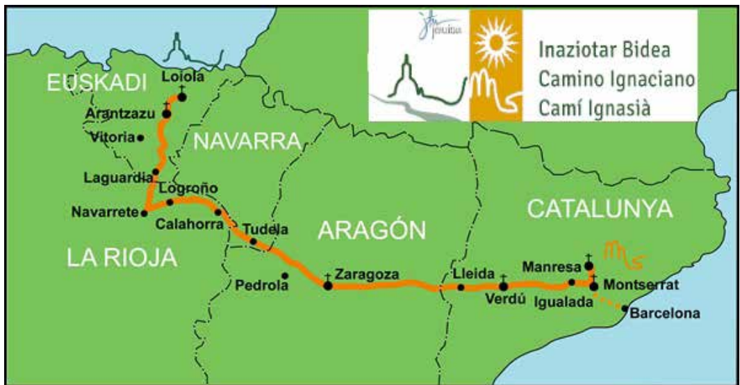
Figura 5: Trazado del Camino de San Ignacio

Fuente: http://caminoignaciano.org . Fecha de consulta: 03/03/2015