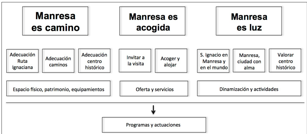
Figura 4: Estructura principal del Plan Director Manresa 2022