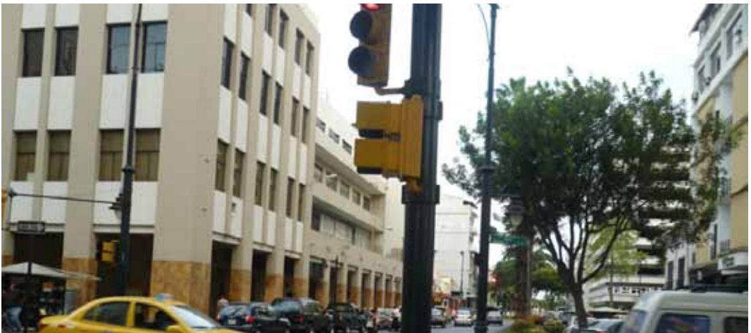
Foto 7: Edificio de Correos del Ecuador (calle Aguirre y Pedro Carbo)

El edificio de Correos del Ecuador, tal como se puede observar en la foto siguiente, presenta un largo pasillo cubierto, rodeado de columnas que conforman un espacio público muy amplio. Antiguamente este edificio albergó a un colegio, pasando luego a ser el edificio de la empresa de telecomunicaciones del Estado, hasta finalmente ser utilizado como el edificio de correos. La arquitectura general del edificio cambió con el transcurso de los años, sin grandes impactos visuales en el conjunto general de su emplazamiento, definiendo el espacio en general con líneas sencilla y funcionalidad.