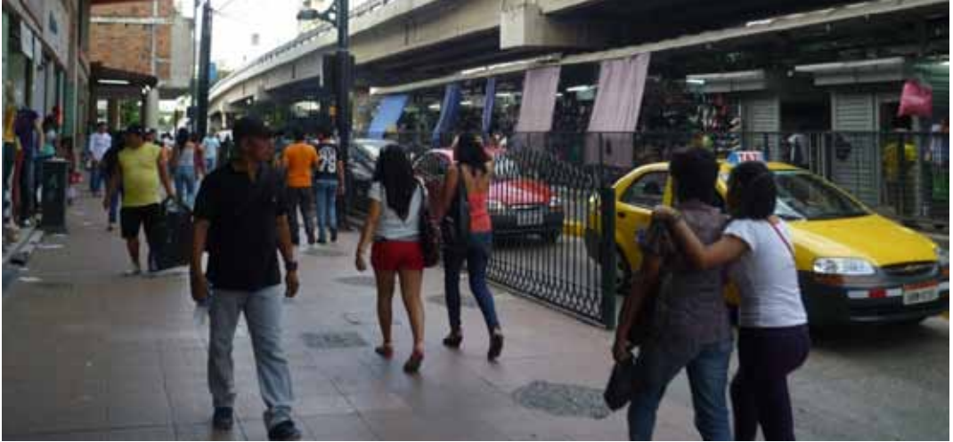
Foto 4: La bahía de Guayaquil, hacia la calle Chile, con el soportal del edificio libre para la circulación peatonal