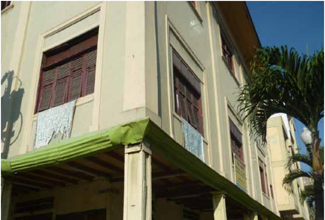
Foto 3: Casa ubicada en las calles Eloy Alfaro y Capitán Nájera, a poca distancia del Malecón Simón Bolívar

Segundo caso: Edificio ubicado en las calles Eloy Alfaro y Capitán Nájera.- Este edificio muestra, como ninguna otra casa de los alrededores de la zona central de la ciudad, las características propias de la arquitectura de Guayaquil: En primer lugar, el soportal que alberga un local comercial; en segundo lugar, la típica construcción mixta (cemento y madera), se puede observar que el piso –que a su vez sirve de techo para el piso inferior- está construido enteramente en madera, mientras que las paredes son una mezcla de caña guadúa y cemento (variante de la quincha, como se mencionó en párrafos anteriores). En ese caso, el soportal queda libre para la circulación peatonal. Aunque no se observa con detalle, en una de las ventanas el dueño de casa ha colocado un letrero que indica que el inmueble es patrimonio cultural de la ciudad. En tercer lugar, las ventanas poseen las llamadas “chazas”: pequeñas rendijas que permiten la circulación de aire al interior de la casa.