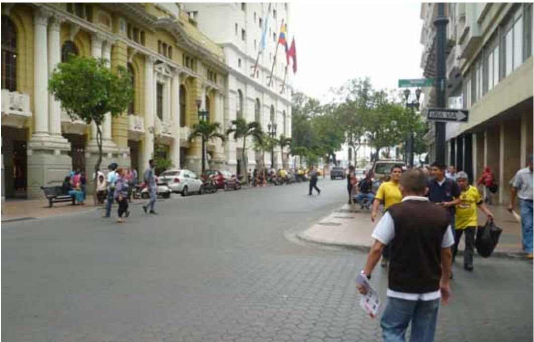
Foto 8: Parte de la Avenida Nueve de Octubre de Guayaquil, con dirección

Como se observa en la foto inferior, la avenida Nueve de Octubre básicamente es un largo callejón cubierto, con las infaltables columnas que sostienen a cada edificio, y con espacio suficiente para que los peatones circulen sin inconvenientes por el sitio.