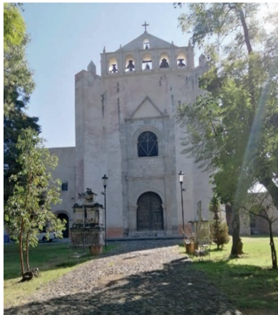
Figura 3: Fachada del Ex Convento de San Juan Bautista