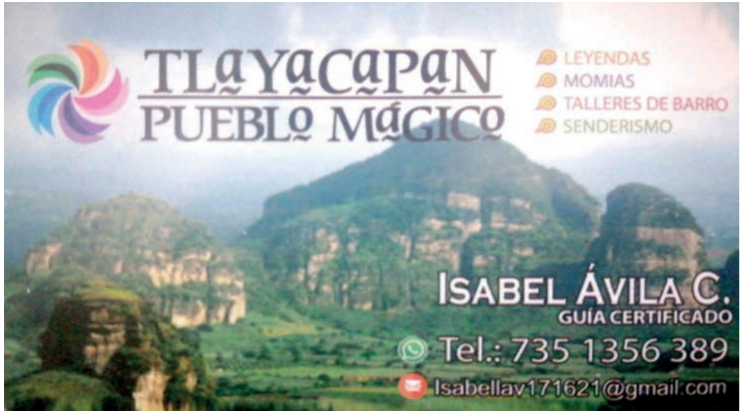
Figura 5: Tarjeta de presentación de un guía de turistas local

Fuente: Fotografía de Alexis Fernando Oliveroz. Tarjeta por cortesía de Isabel Ávila (2022).