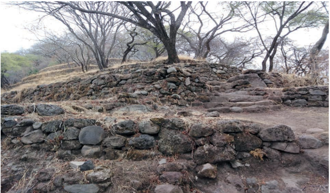
Figura 2: Sitio arqueológico El Tlatoani