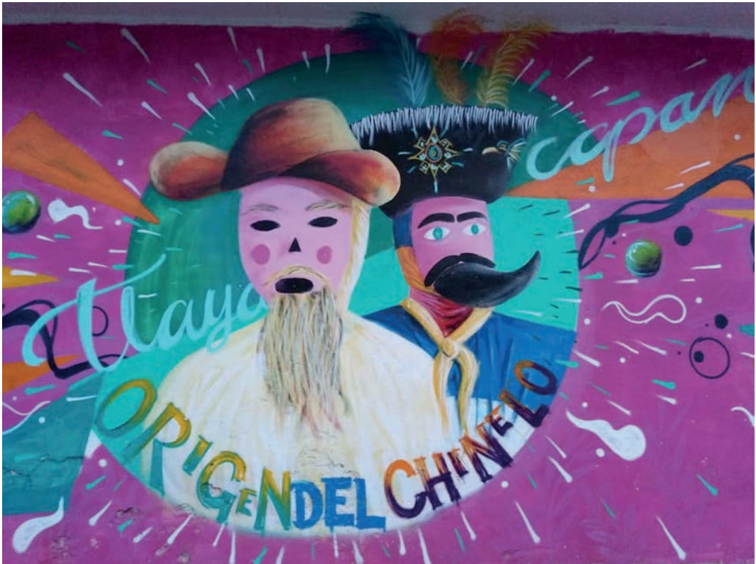
Figura 4: Pintura mural alusiva a la parafernalia del chinelo