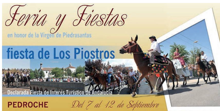
Figura 3: Cartel anunciador de la fiesta de los Piostros.