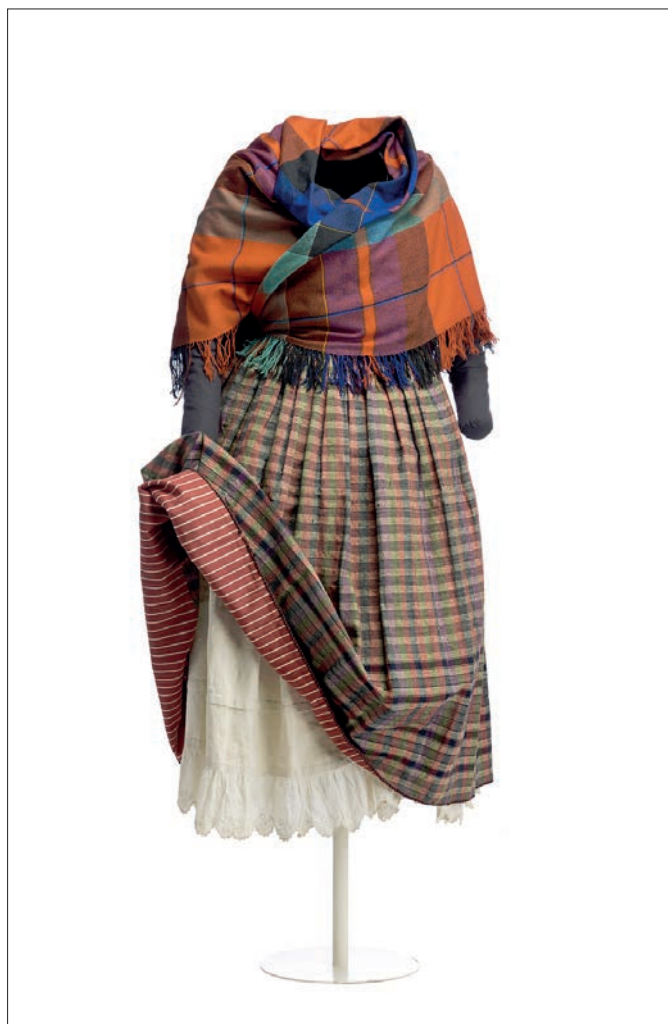
Figura 4: Traje de Mujer procedente de Añora (ca. 1880)