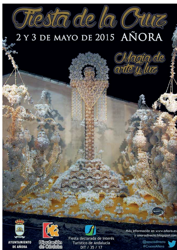
Figura 2: Cartel anunciador de la Fiesta de la Cruz de Añora.