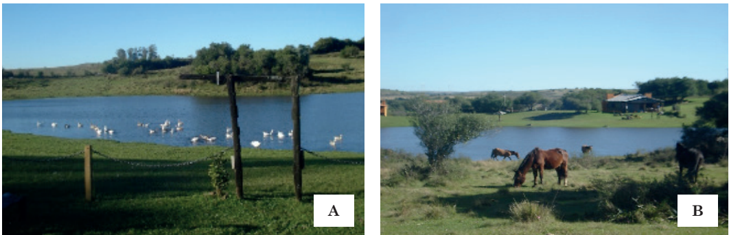
Imagem 2: Lago na Estância da Glória