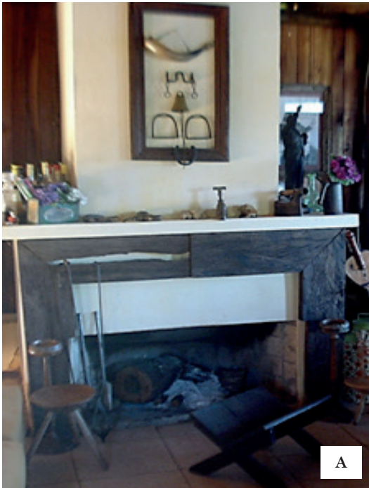
Imagem 5: Esštância da Glória: lareira e decoração (A); retrato de família (B) e mangueira de pedras (C); Fazenda Palomas: artigos do “gaúcho” (D) e detalhe da parede da casa construída com pedras do Cerro de Palomas (E)