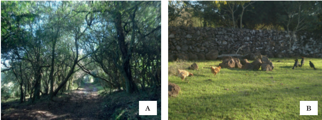
Imagem 3: Estância da Glória: “Túnel Verde” (A) e convivência entre animais domésticos e nativos do Bioma Pampa (B)