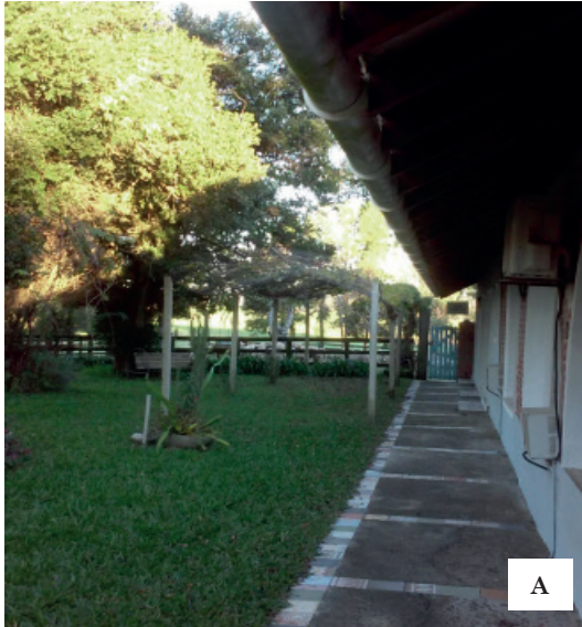
Imagem 4: Fazenda Palomas: Calhas ao redor da casa (A) e rebanho de ovelhas ( ovis aries ) junto a eucaliptos ( eucalyptus ) (B)