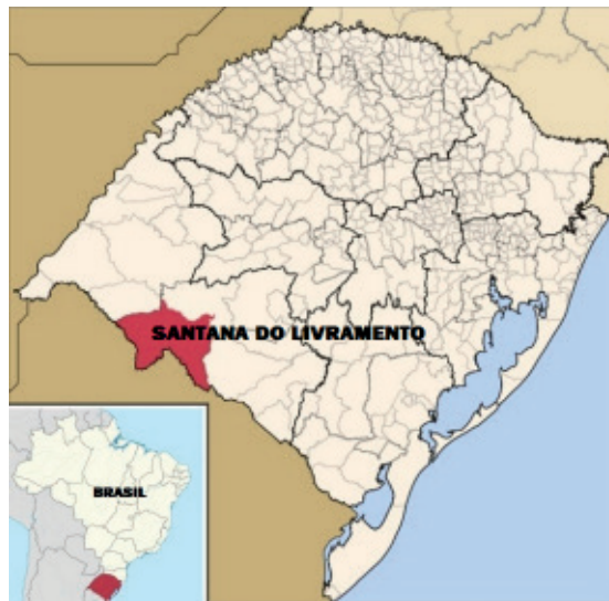
Imagem 1: Localização de Santana do Livramento no estado do Rio Grande do Sul/Brasil