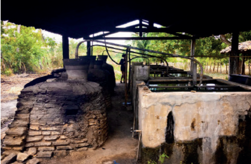
Figura 9: Produção de cachaça a partir da cana de açúcar nos engenhos.