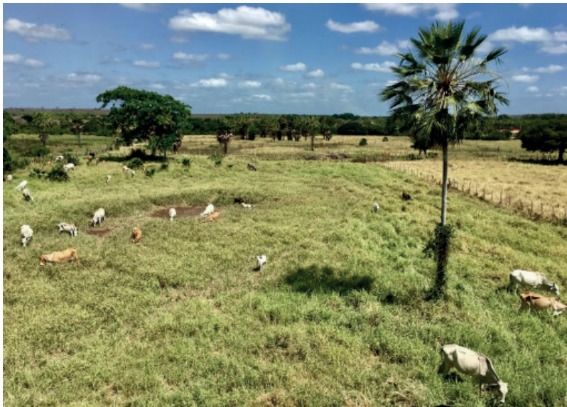
Figura 1: Paisagem rural do município de São Bernardo, Maranhão.

Pires (2001, p.90) identifica a paisagem rural a partir de dois componentes: a paisagem campestre e a paisagem cultivada, os quais conferem o sentido de “lugar” ao meio rural. Dentre eles, destaca os povoados e vilarejos isolados ou confinados; estradas e caminhos de terra; cerca e divisores rústicos, açudes, represas, igrejas, capelas. São esses elementos que tipificam, a priori, o meio rural (Figura 1).