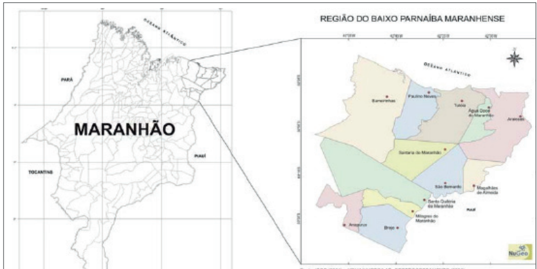
Figura 4: Localização da região do Baixo Parnaíba Maranhense.

A partir desta perspectiva, este estudo volta-se para o município de São Bernardo, Maranhão, localizado a 370 km da capital do Estado, São Luís, e está inserido no território denominado Baixo Parnaíba Maranhense (Figura 4). O município possui uma população de 26.480 habitantes, sendo que destes, 11.800 situam-se na zona urbana e 14.680 residem na zona rural. Sua economia gira em torno dos setores agropecuário e indústria extrativista, setor de construção, comércio e serviços (IBGE, 2010).