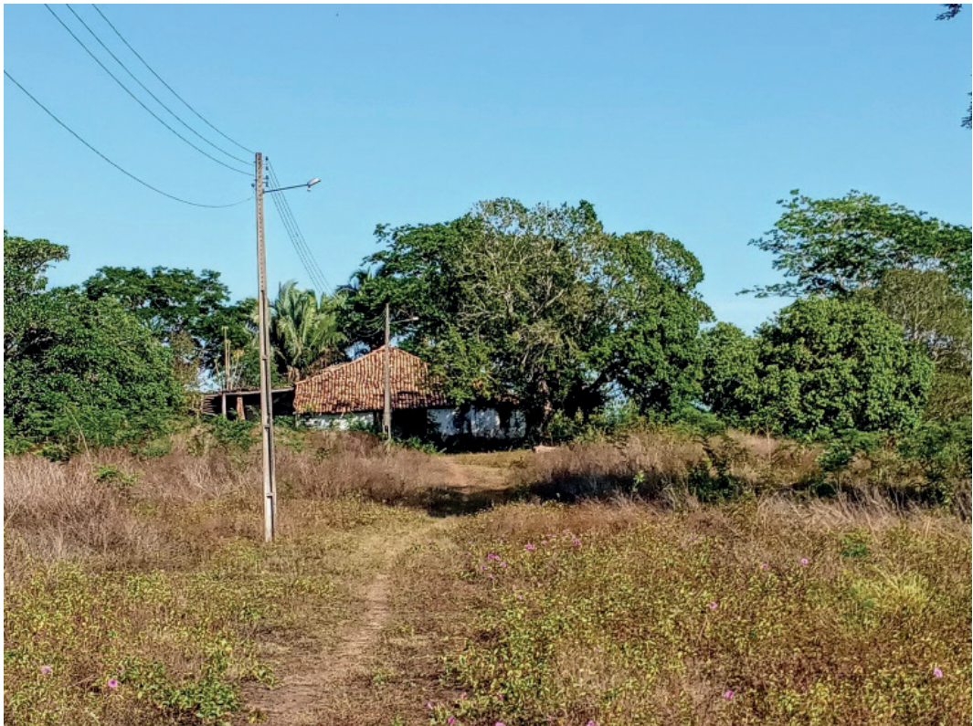
Figura 6: Fazenda Paraíso, Casa Grande e Senzala dos Pires Ferreira.

Considerado um dos povoados mais antigos do Estado do Maranhão, tendo a sua origem datada por volta dos anos 1835, o povoado São Raimundo é um lugar plural e polissêmico, detendo um acervo material e simbólico que remete ao período colonial e que se faz presente nos remanescentes do patrimônio histórico, bem como nas práticas socioculturais tradicionais, tais como a produção de cachaça artesanal, que contribuem para a reprodução social e cultural da comunidade. No povoado, os visitantes deparam-se com potenciais recursos turísticos, como a fazenda Paraíso, casa Grande e Senzala dos Pires Ferreira, Capela São Benedito, o cemitério dos “Negos Cativos” antigos engenhos, os quais materializam as memórias individuais e coletivas (Figura 6).