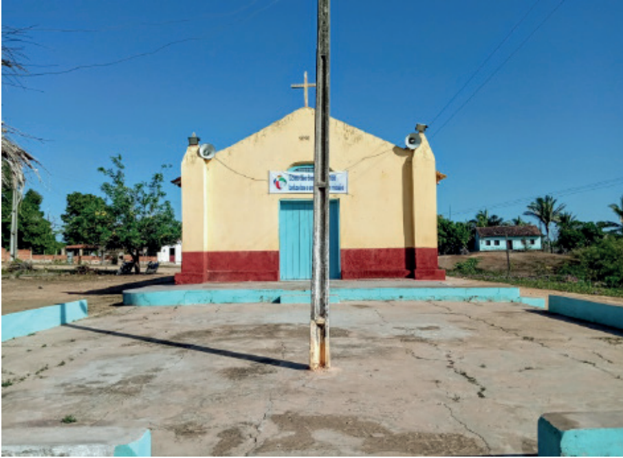
Figura 7: Fachada da Capela de São Benedito