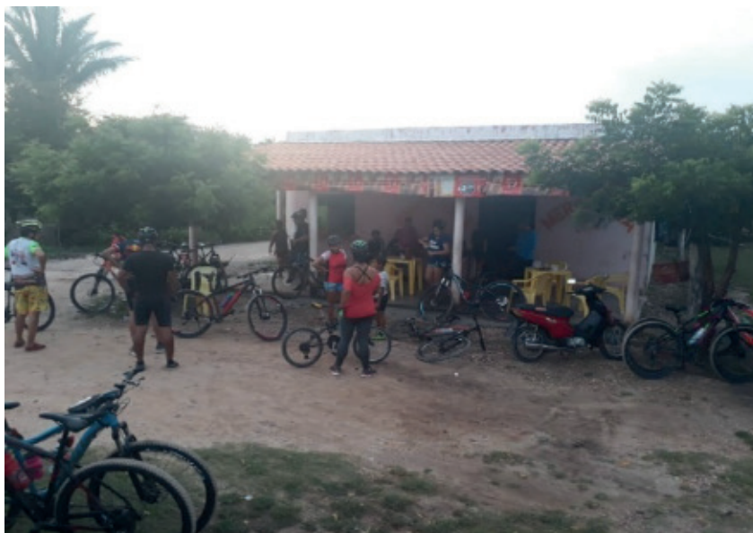
Figura 11: Ponto de apoio aos ciclistas.