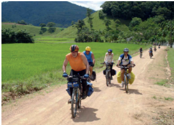
Figura 3: Cicloturismo no Vale Europeu.