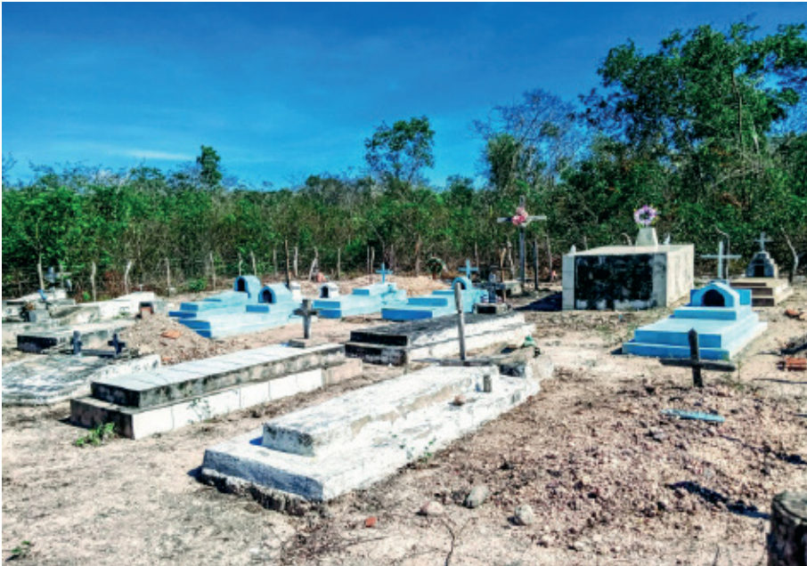
Figura 8: Cemitério construído pelos “Negros Cativos”