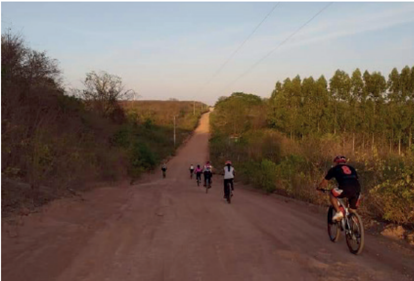
Figura 10: Rota Caldo de Cana.

Os atributos da paisagem local encontram-se conservados, não sendo observados impactos ambientais decorrentes ou não, de processos entrópicos, como a erosão, alargamento do trajeto e lixo ao longo do roteiro, e que poderiam comprometer a integridade do ecossistema local e a qualidade da experiência dos visitantes. Em determinado trecho da rota Caldo de Cana, os visitantes podem realizar paradas para banhos e contemplação da natureza. Ao final do roteiro, moradores servem o caldo de cana, muito apreciado pelos ciclistas, e que deu nome ao trajeto de bicicleta (Figuras 10 e 11).