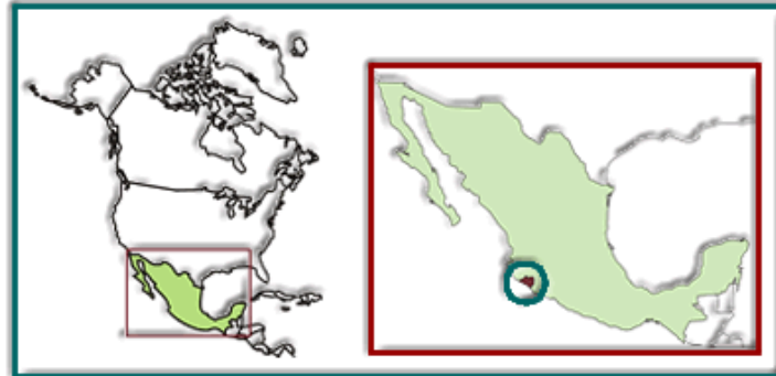
Figura 1. Ubicación del área de estudio.