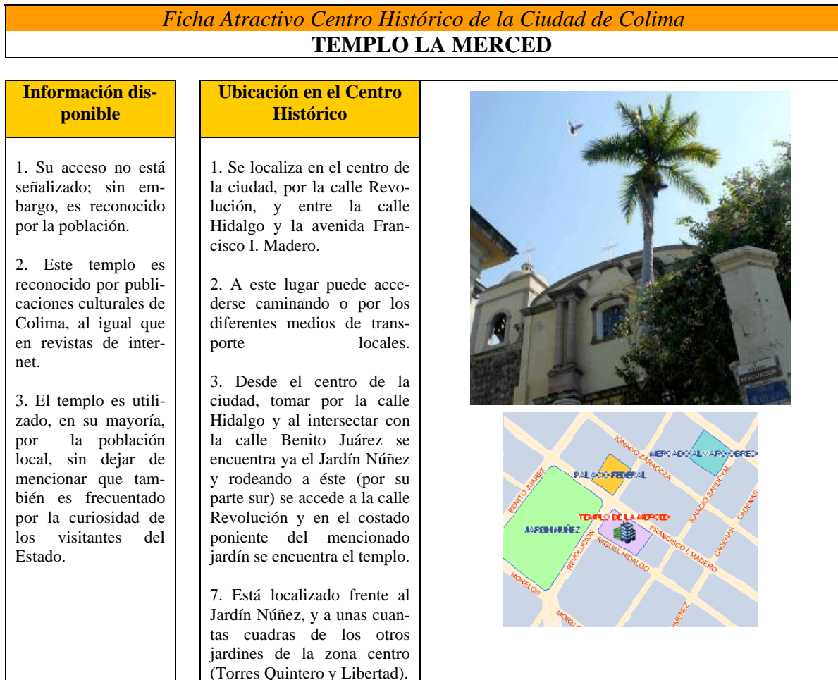
Cuadro 4. Ejemplo de Ficha Técnica de Atractivo Turístico.

Fuente: Fotografía. David Palestino (2008). Mapa:www.localizenet.com