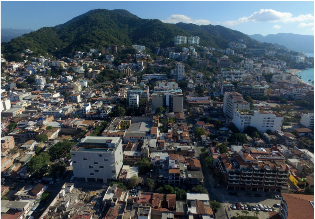
Imagen 2: Transformación de la Zona Romántica por los Desarrollos Inmobiliarios

Las condiciones que prevalecen en la Zona Romántica justifican la oleada de protestas por parte de los residentes, empresarios locales y asociaciones civiles, que una vez más presencian la destrucción de un espacio que sustenta la identidad e imagen del destino turístico debido a la voracidad de los desarrolladores inmobiliarios y a la presunta complicidad de las autoridades municipales (Imagen 2)