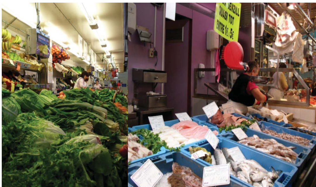
Foto 4. Paradas del mercado de Vilanova i la Geltriu con productos locales.

promoción y comercialización; lo anterior se puede apreciar también en la foto 2, en donde en una parada se promociona uno de los productos de Vilanova como los espigalls.