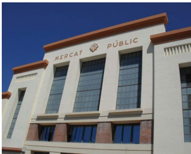
Foto 3. Mercado central de Vilanova i la Geltru.

El mercado central cuenta con un número muy superior de paradas con respecto a las 15 del mercado del mar. Cada una de éstas paradas puede ser susceptible de convertirse en un punto de promoción, degustación