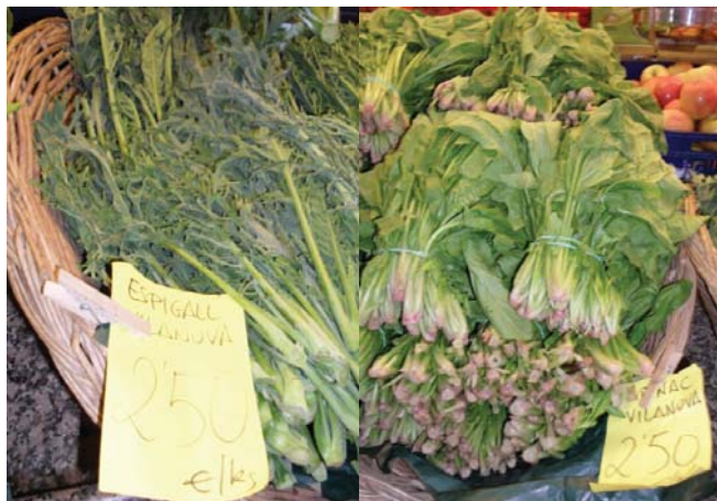
Foto 2. Productos locales vendidos en el mercado.

el pescado y el marisco fresco. La tradición y la sabiduría de los marineros, pasada de padres a hijos, ha enriquecido la gastronomía con platos como: el hervor de atún, el ajo quemado, el rossejat, la espineta, los ranchos de pescado, sepia a la bruta, la allipebre de conejo con galeras y el plato más conocido: el xató.