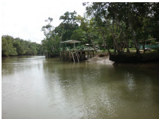
Figura 01. Trapiche da Comunidade de Caruaru

O projeto de pesquisa está sendo desenvolvido numa área descrita pelos geógrafos e estudiosos da Amazônia, como um espaço que se mostra portentoso e interessante sob o ponto de vista hidrográfico. A água figura aí como peça fisiográfica e como elemento cênico, como moldura e como agente modelador. Pode-se dizer que é um privilégio uma cidade possuir em seu território tantas ilhas, baías, rios, igarapés e praias. E é certamente o arquipélago de Mosqueiro, que expressa o caráter de uma cidade constantemente penetrada e fecundada pelas águas amazônicas. E é neste distrito que o projeto desenvolveu