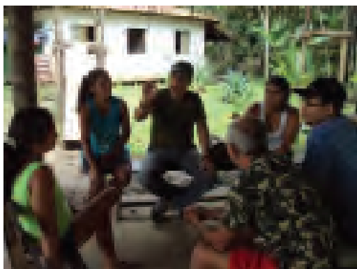
Figura 04. Reunião com representantes dos segmentos escolar e comunitário.

Para o trabalho in loco no que diz respeito às observações, às entrevistas e aos diálogos serão seguidos os procedimentos de Malinowski (1977) -“a etnografia do diário”- complementados pelos ensinamentos de Oliveira (1996) que preconiza na pesquisa de campo o olhar, o ouvir e o escrever, pois