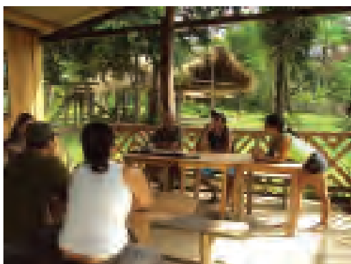
Figura 05. Reunião com o presidente da Associação de Moradores do Caruaru.

O olhar e o ouvir podem ser considerados como os atos cognitivos mais preliminares no trabalho de campo [...] é seguramente no escrever, portanto na