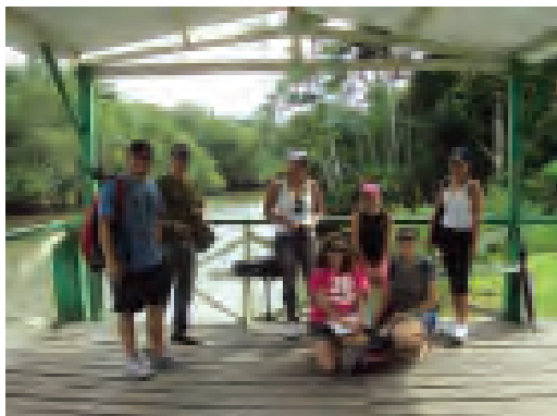
Figura 03. Grupo de Pesquisa.

As metas estabelecidas foram: entrevistar famílias da comunidade e liderança comunitária; elaborar um relatório do Perfil socioeconômico da comunidade; planejar produtos/serviços sustentáveis;