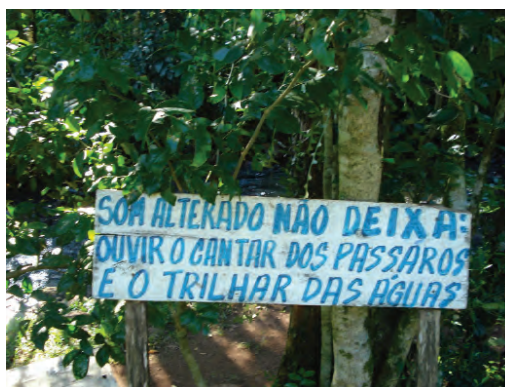
Conselho aos visitantes sobre o comportamento na trilha.

Além do nome da trilha, o Pitoco é também aparece no portal de entrada da trilha, há ainda uma estátua do mesmo no caminho.