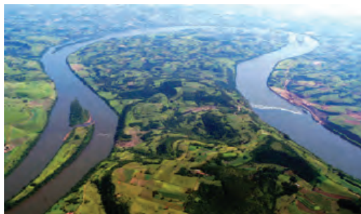
Fotografia aérea da área anterior à construção da Usina Hidrelétrica Foz do Chapecó.

Os caboclos desta região ribeirinha levavam um modo de vida tradicional, de produção agrícola e animal para o auto-consumo e valiam-se da pesca alimentação e eventual venda, de modo informal. Nas décadas mais recentes, houve penetração de descendentes de alemães e ita-