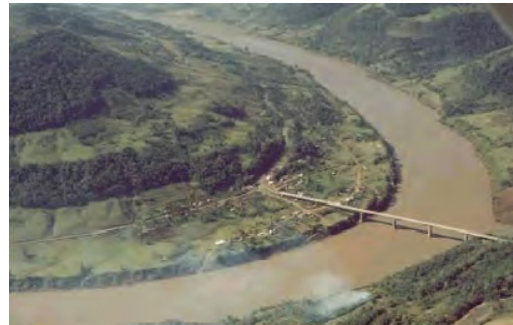
Vista aérea do Goio-En antes da construção da Barragem Foz do Chapecó

Segundo Renk e Savoldi (2009) a relação com a natureza é um dos pontos mais fortemente utilizados para mostrar que os caboclos estariam mais próximos aos “bons selvagens”, em oposição aos colonizadores, que são considerados os respon-