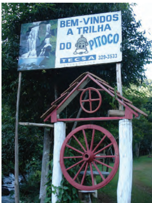
Portal de Boas vindas à Trilha do Pitoco.

caboclo é mais natural, vive sem agrotóxico e veneno. A água que bebe é natural”. Ao invés dos alimentos industrializados valorizam aqueles feitos em casa, recordando do sabor desses, produzidos artesanalmente, como a farinha de beiju fabricada no monjolo ou a farinha de mandioca produzida na atafona. Afiar a faca e foice no rebolo. Cozinhar em panela de ferro. Essa era a alimentação farta e pura dos velhos tempos. Essa vida rústica, vida natural como enfatizam, mostrava que o caboclo enfatizava e enfatiza o natural.