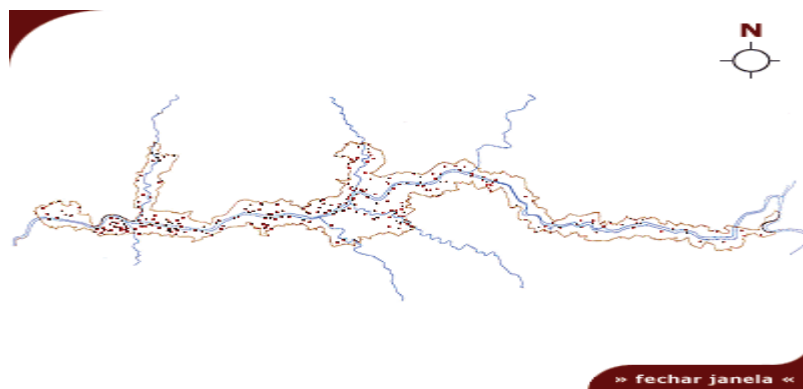
Figura 9 – Quintas e Casais no ADV.

Em 1887, a via-férrea, com a linha do Douro, veio melhorar a rede de acessibilidades da região. Tem uma extensão de 203 quilómetros, localizando-se, na sua grande parte, nas margens do rio Douro. Uma das estações mais emblemáticas desta linha, pelo seu edifício e azulejos, é a estação do Pinhão. Posteriormente, surgiram ramais ao longo dos vales dos rios Corgo, Tua e Sabor, as quais simbolizam uma importante componente do património edificado que é o puzzle ADV. O encerramento ou desactivação parcial destas linhas constitui perda patrimonial