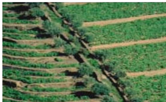
Figura 5 – Socalcos pré (à esquerda) e pós-filoxera (à direita).