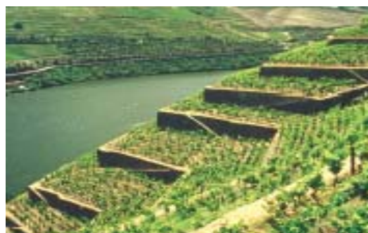
Figura 4 – Vinhas em terraços pós-filoxera.

Para além dos muros em xisto, referência fundamental na paisagem cultural do ADV, servindo para amparar os terraços ou socalcos produzidos para plantar vinha nas suas encostas, outros elementos culturais que testemunham o modo de viver das várias gerações que passaram pelo ADV, influenciado pelas actividades de cultivo da vinha, são os aglomerados populacionais (a), a acessibilidade (b) e elementos religiosos (c).