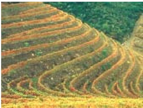
Figura 6 – Vinhas em patamares.

O valor e atractividade dos aglomerados do ADV resultam da sua inserção na dinâmica da paisagem, permitindo uma visão global do território. Materializando a forma de habitar a região, desenvolveram-se adaptando e aproveitando as encostas dos terrenos e reproduzem in-