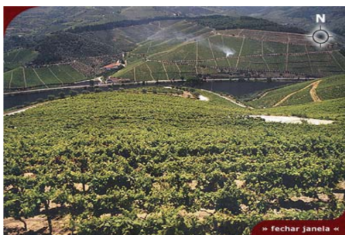
Figura 8 – Vinhas sem armação de terreno.

fluências da vitivinicultura e da sua evolução.