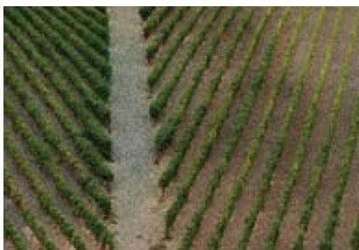
Figura 7 – Vinhas ao Alto.