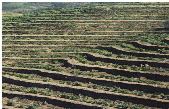
Figura 2 – Socalcos pré-filoxera.

mas distintas de armação do terreno que não necessitam de socalcos e/ou respectivos muros de suporte, estabelecendo uma alteração significativa na configuração da paisagem tradicional. Esta é uma alteração muito importan-