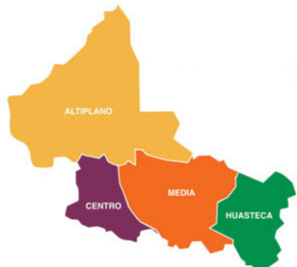
Imagen 2. Localización de las 4 regiones que conforman el territorio potosino.

al desarrollo de oportunidades para poder impulsar el desarrollo humano a nivel individual y a nivel de las comunidades. Sin embargo, los recursos y el potencial que puedan tener las regiones y algunas de sus localidades requieren desarrollar un intenso proceso de seguimiento y monitoreo de todos los aspectos que se encuentran involucrados en la puesta en marcha de estos proyectos. Es decir, se hace necesario relacionar los recursos naturales-ambientales con los intereses económicos, los intereses políticos de los agentes locales y de los agentes extralocales (Rangel Valadés, Norma Lucero 2011; Pineda Manzano, Ulises 2010).