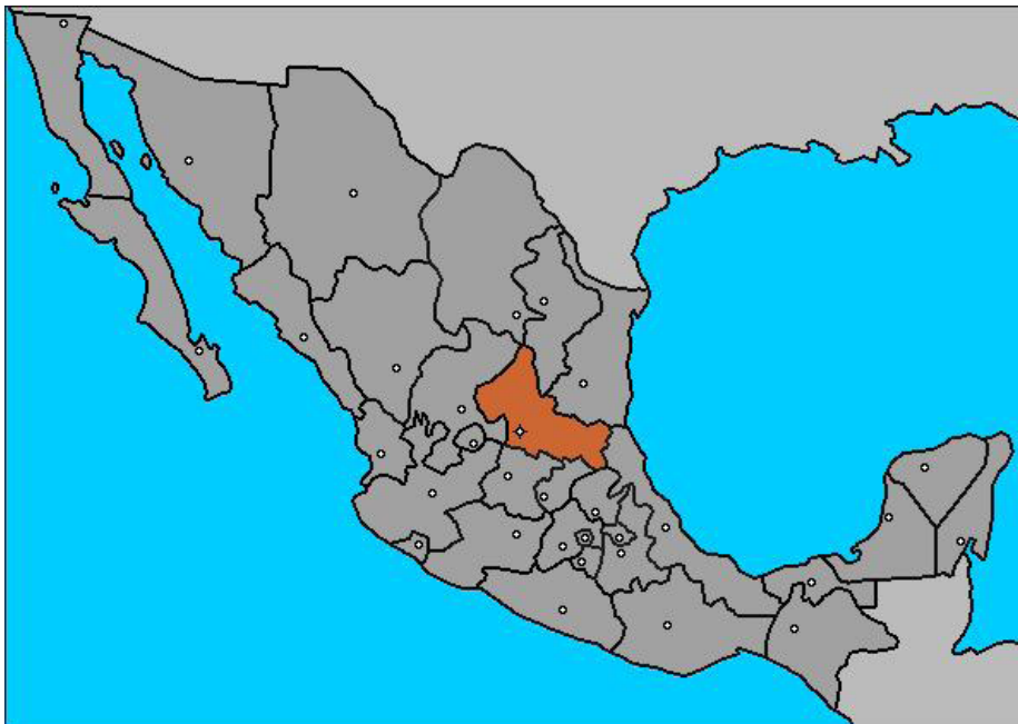
Imagen 1. Ubicación geográfica de San Luis de Potosí .

La categoría preferencial que goza Real de Catorce se manifestó en el anuncio que la Secretaría de Turismo hizo a finales de 2004, cuando dio a conocer que para 2005 se invertirían 4.3 millones de pesos en la localidad, con el objeto de “preservar la belleza y el misticismo de un pueblo espectacular”. Entre otros rubros, estos recursos se emplearían en la rehabilitación de la red de agua potable, apuntalar el túnel de Ogarrio, el cual permite el acceso