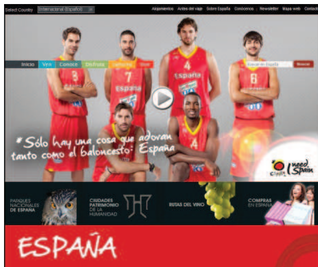
Fig.2 Cabecera de la página inicial

fondo negro, encontramos desglosada la que será, grosso modo , la estructura de las sucesivas páginas del portal: cabecera, cuerpo y pie de página.