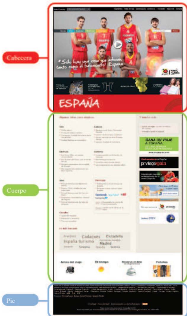
Fig.1 Macroestructura de la página inicial

con la que se pretende dar apoyo a la campaña promocional 'I need Spain'. Entre otras cosas, se subraya, por ejemplo, que esta estrategia genera "menos coste que la promoción en medios convencionales y es más efectiva" 20 .