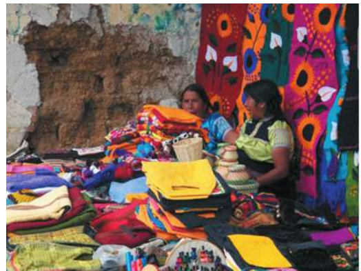
Figura 4. Vendedoras de artesanías en el mercado de Santo Domingo. San Cristóbal de las Casas

Esta aparición masiva de indígenas inmigrantes transforma el antiguo esquema de superioridad ladina en la ciudad. Actualmente los indígenas representan el 37% de la población total