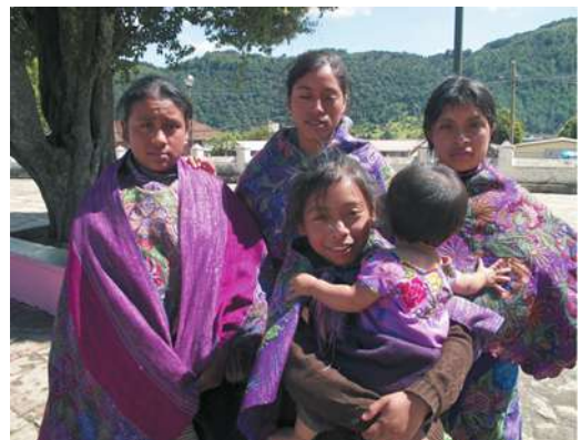
Figura 7. Posando para los turistas. Zinacantán

En la actualidad Zinacantán ha entrado como lugar de visita obligada entre los tours turísticos de la región. Se visita la iglesia de San Lorenzo y la capilla del Señor de Esquipulas, pero el plato fuerte es la visita a una familia de tejedoras indígenas que han transformado su casa en una tienda de textiles. El antiguo mercado de artesanías ha perdido clientela porque las casas particulares son un buen negocio y un escenario ideal para el turista. Las tejedoras pactan con los guías turísticos y pagan sus servicios