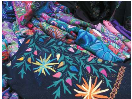
Figura 12. Nuevos modelos de textiles zinacantecos. San Cristóbal de las Casas

Las desigualdades económicas entre los indígenas se manifiestan entre los que sobreviven de una precaria economía informal insuficiente para la subsistencia y los que controlan algunas esferas económicas y han podido subir en la escala social y económica. Las organizaciones internas de los inmigrantes han sido la base fundamental para capturar algunos de los espacios urbanos y las más poderosas son las que controlan el transporte y el comercio urbano. Entre ellos se encuentran los comerciantes que venden artesanías al aire libre y los que tienen puestos de venta fijos en los mercados municipales. 17 Estos espacios comerciales se han convertido en verdaderas áreas de disputa entre indígenas y ladinos en su intento por conseguir el control de la venta. Hoy en día la zonas más solicitada para el comercio de artesanías son las que rodean las iglesias de Santo Domingo y la Caridad, y el mercado municipal José Castillo Tielemans para la venta de alimentos y otros enseres. Ambos espacios han sido intento de desalojo varias veces, algunos de forma violenta, por parte de las autoridades por la presión que reciben de los coletos que pretenden limpiar la zona de indígenas y recuperar el control comer-