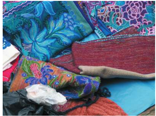
Figura 1. Textiles indígenas

Las mujeres confeccionan una amplia gama de textiles desde los trajes típicos de cada comunidad indígena hasta manteles y servilletas, cojines, colchas, tapetes y caminos de mesa con diferentes diseños, bordados e hilos de colores. El traje indígena incluye para las mujeres faldas largas, huipiles o blusas bordadas, cinturones, chales o rebozos, las cuales varían de un municipio a otro, han ido cambiando con el paso de los años y han devenido parte de la identidad indígena femenina de la región. Al contrario de la mayoría de los hombres que únicamente utilizan algunas prendas ceremoniales en los rituales comunitarios, las mujeres indígenas, sea por imposición, para resaltar su origen comunitario, para diferenciarse, como resistencia, o medida de opresión de los mestizos, han utilizado un tipo de vestimenta que las caracteriza como indígenas. Algunas prendas se producen de forma manual y otras a máquina, en talleres familiares o industriales, al por mayor y al detalle, se repiten diseños o se innovan nuevos, con figuras geométricas o naturales, utilizan brocados o bordados con hilos naturales o sintéticos, se convierten en prendas cotidianas, en vestidos ceremoniales, en el ajuar de huipiles y mantos sagrados de sus vírgenes y santos, o sencillamente acaban siendo convertidas en mercancías para la venta. El traje indígena así juega con múltiples significados y ha pasado de ser un estigma y perteneciente al indio colonial