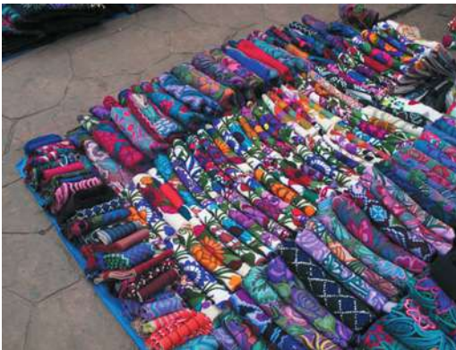
Figura 13. Fabricación y venta al por mayor. San Cristóbal de las Casas

En el mercado de artesanías de Santo Domingo, las mujeres indígenas que se dedican a ser vendedoras se abastecen de mercancías en lugar de producirlas. Los ritmos de venta dependen de las estaciones turísticas, con una mayor afluencia en verano, en Navidad y Semana Santa. Los productos los consiguen en talleres familiares como los de Zinacantán