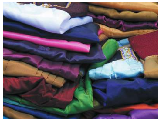
Figura 14. Detalle nuevos colores blusas chamulas

Las tejedoras y vendedoras buscan nuevas formas de subsistencia basadas en un trabajo manual o industrial ahora revalorizado a nivel global y han renovado su trabajo para incorporar textiles híbridos mezcla de los gustos que adopta el consumidor. Son estrategias comerciales que se adaptan a un nuevo contexto, en la que se entra en dinámicas de un mercado capitalista en donde se mercantiliza al objeto pero también a las personas mismas que comercializan. Por eso, el ambiente en donde se efectúa la transacción es esencial y se requiere la escenificación turística para legitimar la autenticidad de la artesana y su artesanía. El turismo ha convertido el negocio textil en una atracción, pero también en un próspero negocio para quienes controlan algunas partes del proceso. Ahora la disputa se establece por productos innovadores y espacios adecuados de venta. Aquí aparecen una gran cantidad de escenarios posibles en donde las mujeres intentan entrar y mantenerse en este comercio de éxito. Algunas se convierten en tejedoras expertas a tiempo completo y producen y venden en toda la región, otras combinan su trabajo textil con otras actividades mercantiles y