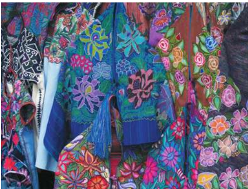
Figura 5. Mercancías indígenas en el mercado de Santo Domingo. San Cristóbal de las Casas

Además, a principios de los noventa los indígenas consolidan algunos monopolios comerciales en toda la región. Así, Freyermunt y Manca (2000) señalan el control al por mayor que tienen los indígenas del negocio de la madera de la región, los zinacatecos se dedican al cultivo y venta de flores y la elaboración de textiles, en Larráinzar, Tenejapa, y Chamula las mujeres producen telas, brocados y prendas de vestir, en Amatenango del Valle fabrican alfarería, mientras los chamulas controlan el comercio del aguardiente posh 14 y proveen de hortalizas y frutas a la población indígena y mestiza de los Altos. Por último, una parte del transporte urbano, todo el transporte que se dirige a las comunidades y el comercio urbano está en manos de indígenas tzotziles y tzeltales que residen de manera permanente en San Cristóbal. Los coletos por su