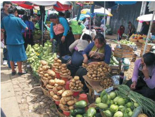
Figura 3. Vendedoras indígenas en el mercado José Castillo Tielemans. San Cristóbal de las Casas

El auge del turismo y de la inversión que aparece en la ciudad, con construcciones del mercado central de alimentos y artesanías José Castillo Tielemans y el periférico norte, contrasta con la economía de subsistencia que mantiene la gran mayoría de población indígena de los parajes, con pocos excedentes agrícolas, y sin el control de sus productos alimenticios y artesanales. Para complementar su economía, los indígenas se ven forzados a migrar y se convier-