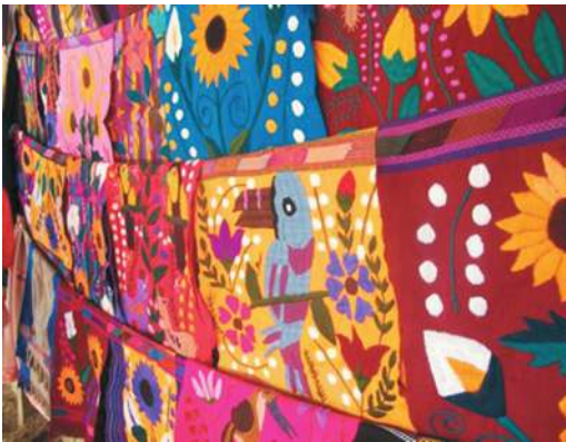
Figura 15. Textiles para la venta. Zinacantán

Así, lo que parece a primera vista una producción artesanal y a pequeña escala, es en realidad un complejo entramado de redes informales que se forman entre diferentes tipos de actores sociales que construyen redes, alianzas y competencias diversas. El mercado turístico permite una demanda continua de mercancías que, a menor escala, también son consumidas por la población femenina indígena. Los significados de estos atuendos por parte de las mujeres indígenas están adquiriendo un sentido de estatus y pertenencia; en las localidades rurales refieren a un resignificación del traje tradicional, mientras en la ciudad se asocian a una forma combinada