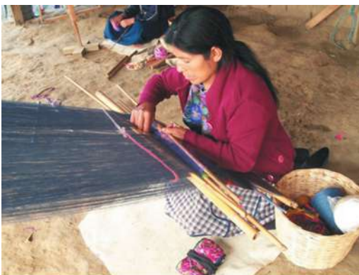
Figura 8. Tejiendo en el telar de cintura. Zinacantán

Tras este mundo aparente de tradiciones ancestrales se esconde un complejo sistema