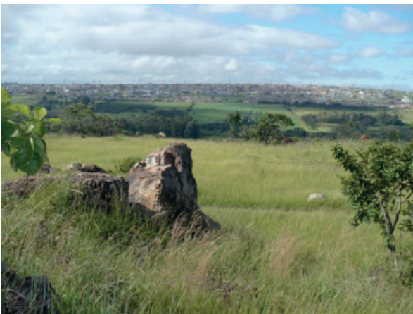
Figura 5: Afloramento rochoso de quartzito com vestígios de lascamento paleoíndio e instrumento lítico lascado do tipo plano-convexo resgatado do complexo arqueológico