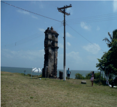
Figura 4: Ruínas da antiga missão religiosa em Joanes (Salvaterra/PA)

Na Amazônia colonial encontrei contrastes de um Brasil diferente dos outros. Comecei revistando um sítio arqueológico histórico icônico chamado Joanes, localizado no distrito homônimo do município de Salvaterra, no arquipélago do Marajó, Pará. O sítio em questão é classificado como multicomponencial 7 , com a presença marcante de estruturas arruinadas da antiga Igreja de Nossa Senhora do Rosário (Figura 4), século XVII, relacionada à ocupação missionária franciscana no arquipélago (Schaan & Marques, 2012). Ali é a praia do rio-mar, com água salobra do estuário do rio Amazonas, a atração principal do lugar. O sítio arqueológico ocupa hoje a principal área pública da comunidade. Entretanto, enquanto fenômeno turístico, ele pouco participa da cadeia comercial, o que pode ser interpretado como algo positivo visto que o abuso de sítios arqueológicos para fins de lazer e turismo é sempre o maior argumento contra aproveitamentos e adequações. Na maior parte das observações que fiz em campo, ao longo de 2013 a 2015, a principal atividade turística registrada no entorno das ruínas se limitava à poucos turistas posando para fotos.