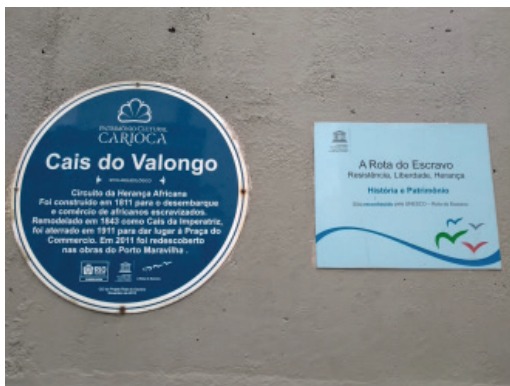
Figura 2: Cais do Valongo, zona portuária da cidade do Rio de Janeiro/RJ, Brasil