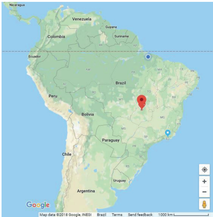
Figura 1: Regiões Centro-Oeste (vermelho), Sudeste (azul claro) e Norte (azul)