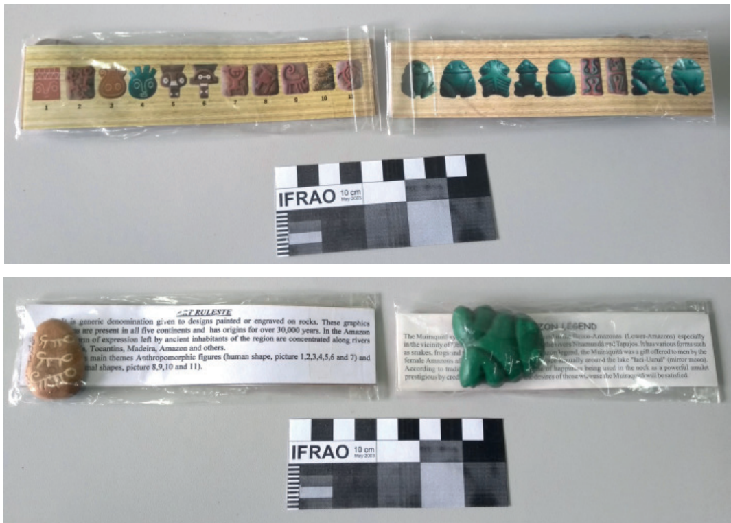
Figura 6: Tipologia de souvenirs (imas de geladeira) com inspiração arqueológica à venda em pontos turísticos de Belém

À direita com decoração inspirada em motivos rupestres, à esquerda em réplica de muraquitã (artefato arqueológico amazônico em formato de sapo e outros répteis, originalmente esculpido em pedra e de procedência indígena pré-colonial).