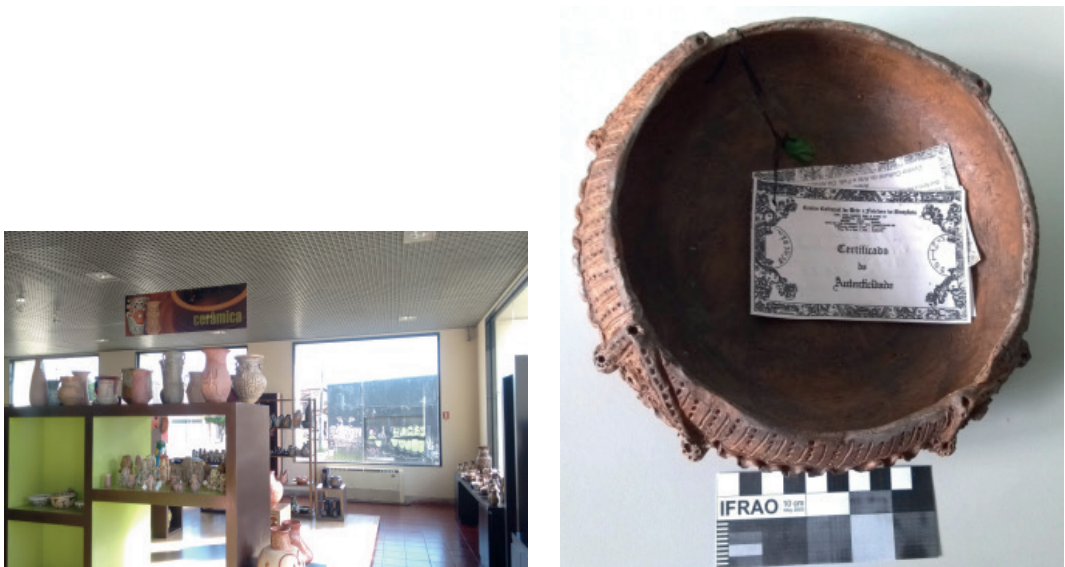
Figura 7: Comercialização de réplicas e cerâmicas com inspiração arqueológica na cidade de Belém