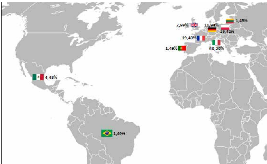
Figura 1: Lugares de procedencia del estudiante internacional de la universidad de Córdoba

De acuerdo con las encuestas realizadas, el perfil del estudiante internacional de la Universidad de Córdoba es mayoritariamente femenino (74,63%). La edad media se sitúa entre 21 y 22 años. Un 82% de los estudiantes internacionales que recibe la universidad de Córdoba visita esta ciudad por primera vez frente a un 18% que repite experiencia. De éstos últimos, cerca de la mitad (46.15%) han visitado la ciudad más de 3 veces. La duración media de la estancia es de 10 meses, lo que supone un curso académico en su totalidad. El lugar de procedencia del estudiante internacional registra un claro predominio europeo (94,03%) como consecuencia del desarrollo en el tiempo del programa ERASMUS. En la siguiente Figura 1 se puede observar con más nivel de detalle los orígenes del estudiante internacional.