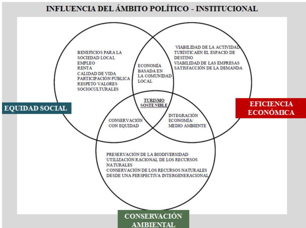
Gráfico 2: Modelo conceptual del turismo sostenible.