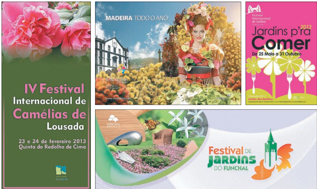
Figura 7: Exemplos de Festivais de Flores e Jardins a nível nacional