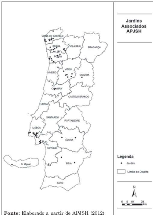
Figuras 3 e 4: Jardins Históricos associados da APJSH e alguns exemplos (Parque de Serralves e Jardim Botânico de Coimbra)

O jardim português, embora não seja dotado da grandiosidade e opulência dos jardins do centro da Europa e Grã-Bretanha no que diz respeito aos traçados, materiais, decoração ou dimensão, reúne um conjunto de predicados (desde a localização, ao clima, história sociopolítica e económica à topografia) que por serem tão específicos de uma cultura, e raramente vislumbrados nos grandes jardins europeus, fazem com que o jardim português tenha um carácter origi-