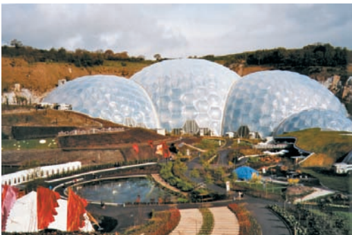
Figuras 1 e 2: Eden Project e Alnwick Garden

O turismo de jardins tem origens na Europa, particularmente em Inglaterra onde se desenvolveu o conceito de garden tours impulsionado pelo National Garden Scheme e o The National Trust , e na Alemanha com os Federal Garden Shows (Bundestagshaus) (Thomas, et al., 1994), constituindo por isso uma prática enraizada e desenvolvida nestes países. Todavia, não é menos importante na França, Nova Zelândia, Austrália, Singapura, Japão, Irlanda, Holanda, Canadá ou Estados Unidos da América (Thomas et al., 1994; Evans, 2001; Fox, 2006; Fox, 2007; Blandigneres e Racine, 2002; Connell e Meyer, 2004), há muito familiarizados com este tipo particular de turismo. Constitui, no entanto, uma novidade as proporções e a dimensão que