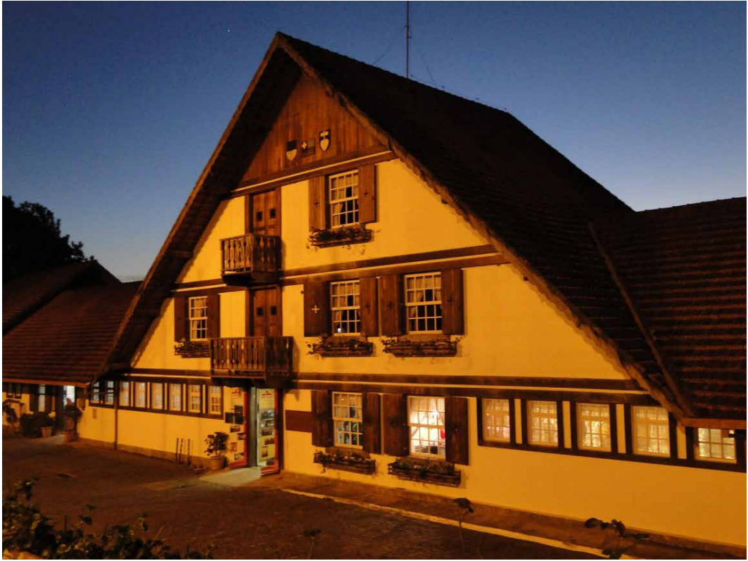
Imagem 5: Casa Suíça, distrito do Campo do Coelho, Nova Friburgo [RJ], 17 jun. 2012 [doc. Fot.]