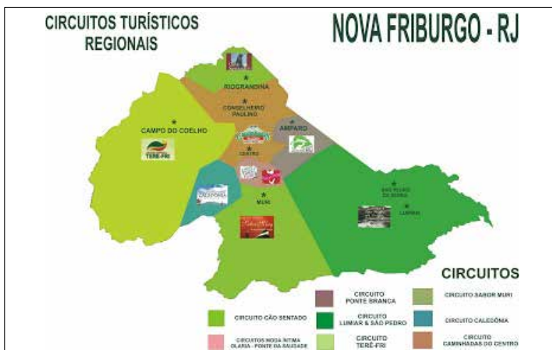
Imagem 2: Reprodução gráfica dos distritos turísticos de Nova Friburgo, 2009.