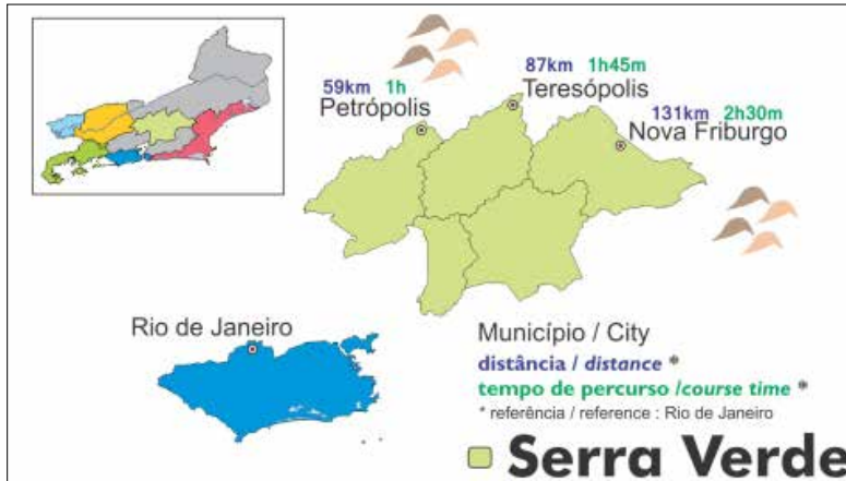
Imagem 1: Reprodução gráfica do destino Serra Verde Imperial, Rio de Janeiro, 2012

Nova Friburgo atualmente faz parte de uma região turística consolidada e de projeção internacional: a Serra Verde Imperial cujo município referência é Petrópolis (ver Imagem 1). Sua proximidade com a metrópole fluminense, assim como a gastronomia variada e a tradição cultural das diversas etnias que o compõe são fatores para a atratividade (Rio de Janeiro, 2006).