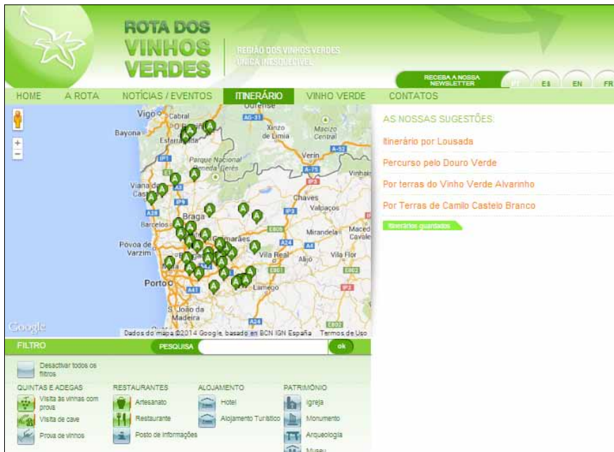
Figura 3: Gerador de Itinerários

A partir da informação residente no sistema de animação web da Rota da Região dos Vinhos Verdes, na opção “Itinerário”, pode ser construído um itinerário, uma “rota”, de acordo com as preferências e restrições do utilizador. Através de um interface WWW, este módulo gere a criação dos itinerários, apresentando-os aos utilizadores num mapa (ver Figura 3).