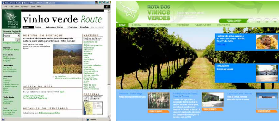
Figura 1: Evolução dos Sistemas Web da Rota dos Vinhos Verdes, o VVRoute em 2006 e o Sistema de Animação em 2014