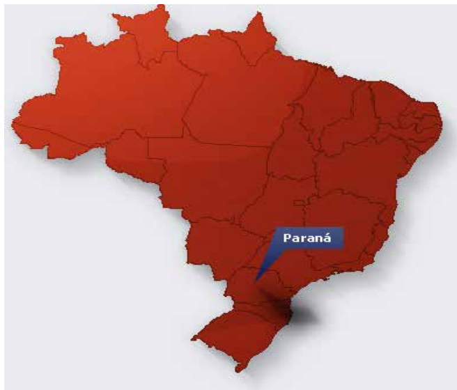
Figura 1: Mapa do Brasil com destaque para o Estado do Paraná