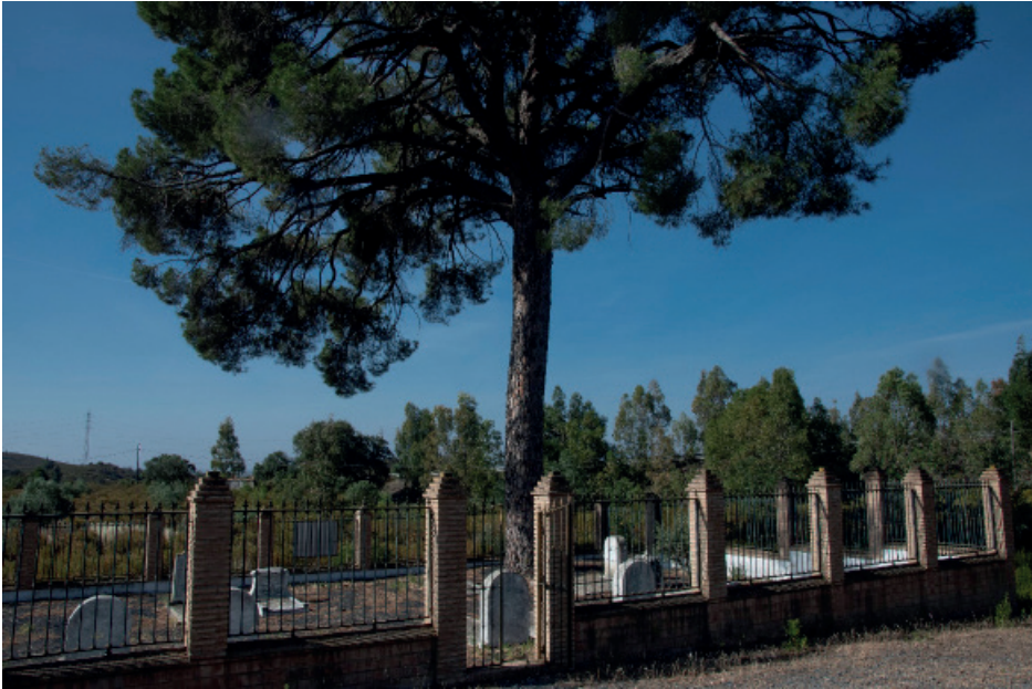
Figura 12: Cementerio Británico