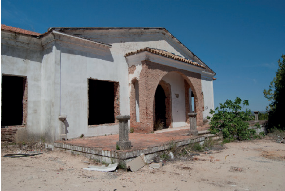
Figura 10: Casa del General Manager