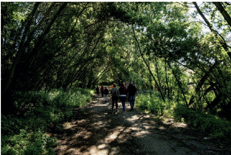
Figura 7: Paseo de los aromos