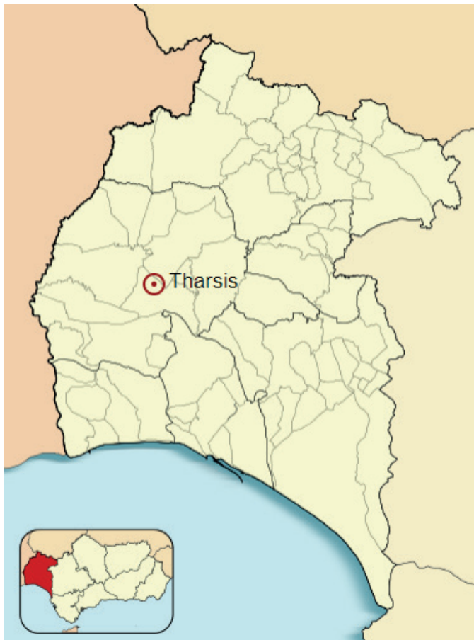
Figura 2: Ubicación de Tharsis

Situada en la comarca del Andévalo, es uno de los principales distritos mineros de la FPI, conociéndose 16 depósitos diferentes, con masas minerales que van desde las 50.000 tn hasta los 55 Mt. (Pinedo, 1962), (Figura 2).