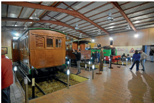
Figura 5: Interior del museo ferroviario en Tharsis

https://huelvabuenasnoticias.com/2014/12/06/inaugurada-la-ampliacion-del-museo-minero-de-tharsis/