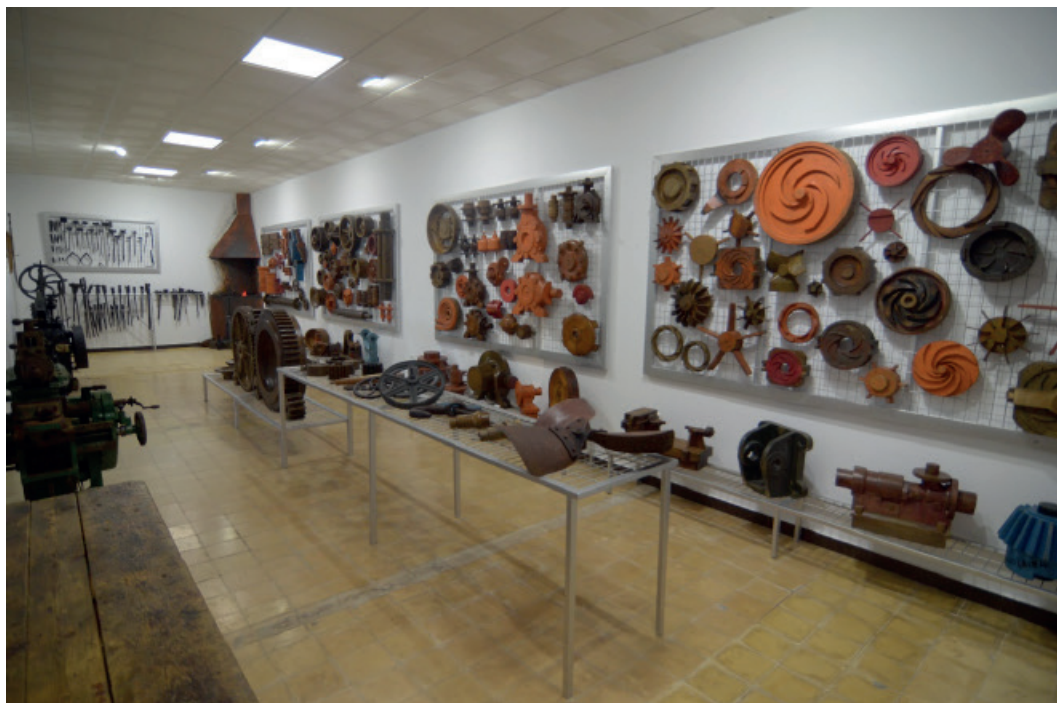
Figura 14: Sala temática de modelos de fundición