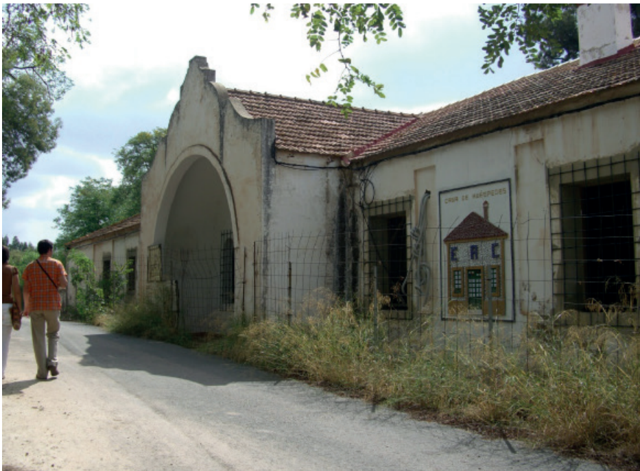
Figura 13: Casa de Huéspedes en barrio Pueblo Nuevo