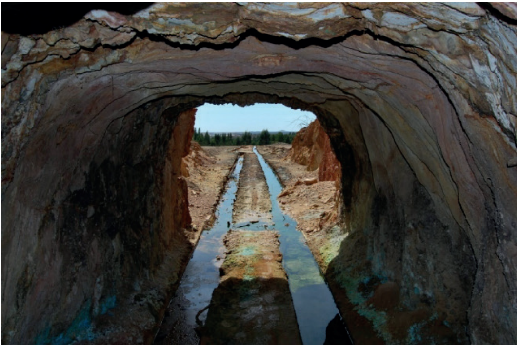
Figura 9: Galería Sabina