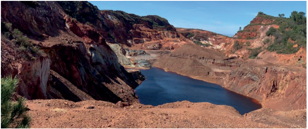
Figura 8: Filón Sur y Pico del Oro