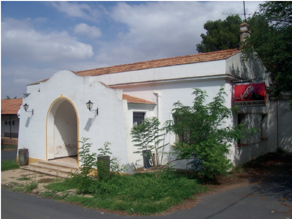
Figura 11: Edificio del antiguo Club de los Ingleses