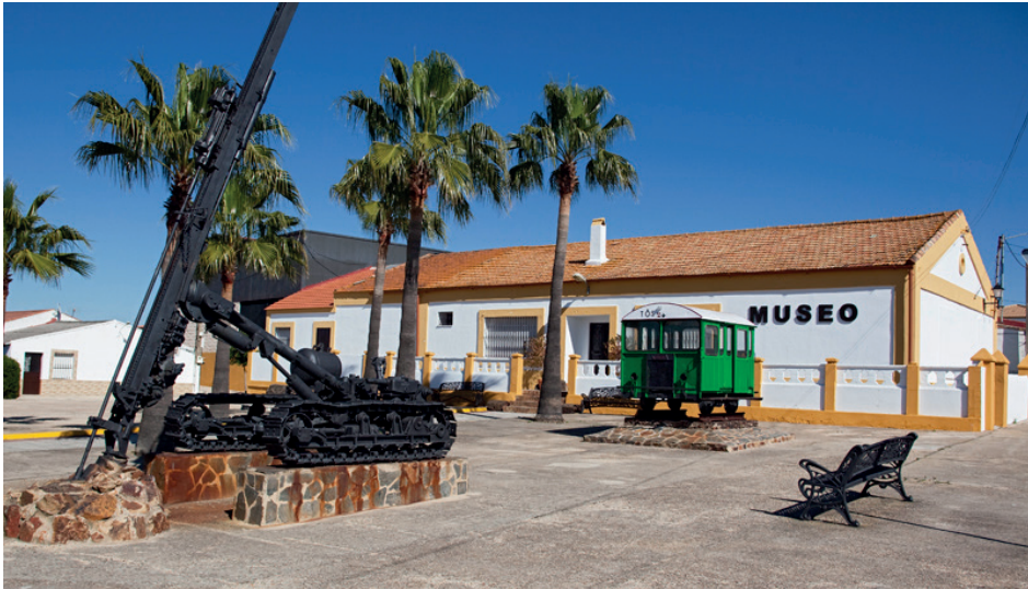
Figura 4: Museo minero en la localidad de Tharsis