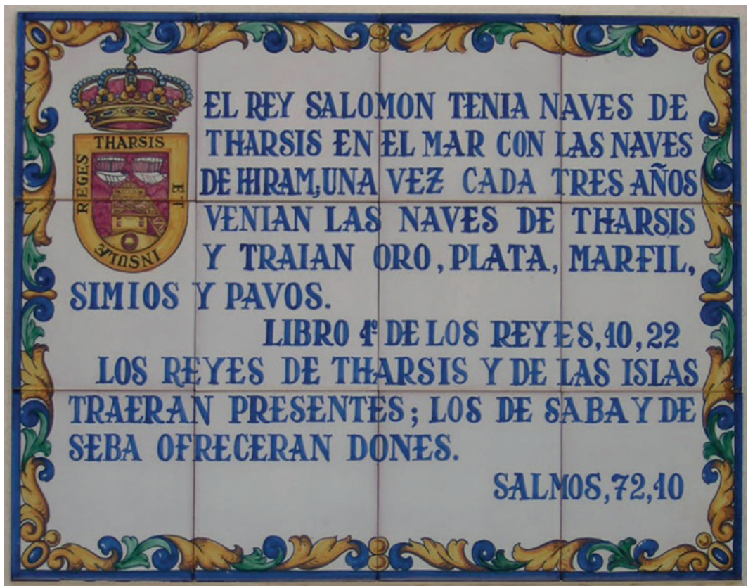
Figura 3: Pasaje bíblico recogido en un azulejo en el Ayuntamiento de Tharsis

La siguiente etapa de apogeo minero-metalúrgico se produce a partir del año 43 a.C. en que dio comienzo con el emperador Augusto, alcanzando su mayor esplendor entre los años 250 y 275 d.C (Pérez, 1998). Posteriormente, fue decayendo poco a poco la producción hasta paralizarse en el siglo V. Tras la caída del imperio romano el beneficio de las minas quedó olvidado por un largo periodo de tiempo. Existe la historia de que el oro de Tharsis fue para cubrir el vellocino de Jasón y los argonautas o, la que se consideraba mina del Rey Salomón tal y como queda recogido en la entrada del Ayuntamiento de la localidad (Figura 3).