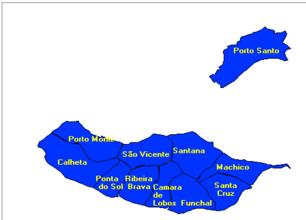
Mapa 1 - Concelhos da Região Autónoma da Madeira