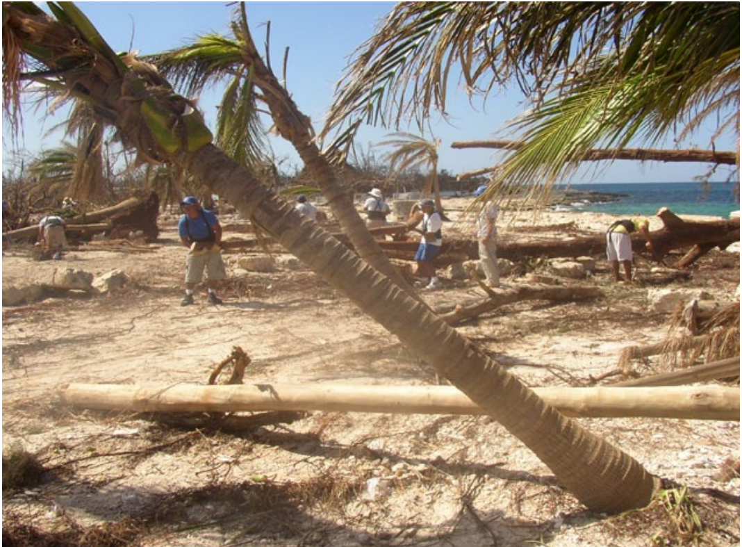
Ilustración 1. Destrucción del Parque Chankanaab por “Wilma”

El principal factor de corrección (FC) de origen natural es la precipitación (FCpre) en la forma de huracanes, que se acompaña de anegamientos (FCane). Los que afectaron al Parque fueron “Emily” (julio de 2005), que obligó al cierre temporal (FCctem) por 15 días y “Wilma” (octubre de 2005) durante ocho meses (Ilustración 1). Esta restricción es absoluta ya que implica un riesgo para la seguridad de las personas y no es posible establecer valores promedio ya que los procedimientos determinan la restricción total del acceso al Parque y se habilita nuevamente al público cuando no existen situaciones de anegamiento u otros riesgos. Con respecto al brillo solar (FCsol), no se considera un factor restrictivo, sino parte del atractivo turístico demandado por los visitantes.