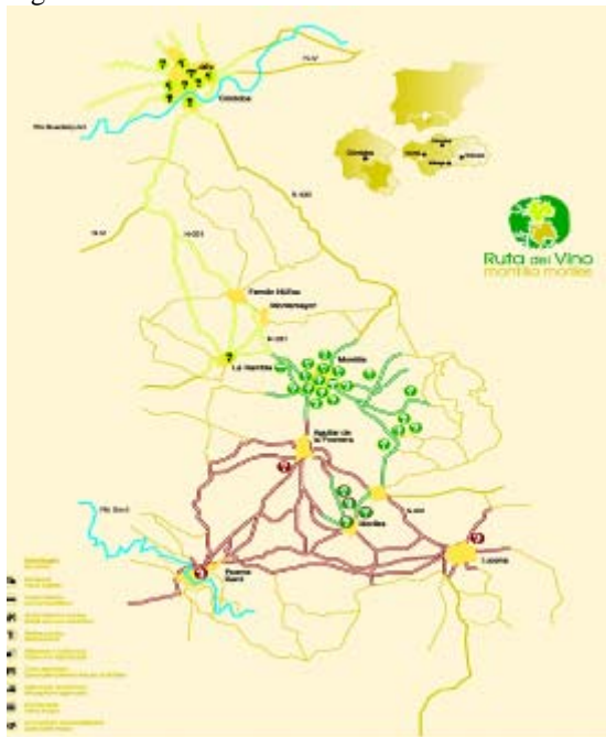
Figura 2. Ruta del Vino "Montilla-Moriles"

La Ruta del Vino Montilla-Moriles 1 nace a principios de 2001, en el marco de los compromisos adquiridos por el Ayuntamiento de Montilla, como ciudad del vino, con ACEVIN. En abril de 2001 se constituye la Asociación para la Promoción del Turismo del Vino (AVINTUR), ente gestor que se ocupa de gestionar la Ruta del Vino Montilla-Moriles. Como anteriormente hemos señalado es imprescindible la creación de un ente gestor para el desarrollo de una ruta enológica ya que la creación de estas alianzas estratégicas entre diferentes actores es uno de los elementos clave para el éxito de cualquier ruta enológica (Telfer, 2001). En este momento, forman parte de la ruta 39 entes públicos y privados, destacando especialmente bodegas y alojamientos rurales. La ruta discurre por el sur de la provincia de Córdoba y atraviesa nueve municipios (Aguilar de la Frontera, Córdoba, Fernán Núñez, La Rambla, Lucena, Montilla, Montemayor, Moriles y Puente Genil). En la Figura 2 se recoge el croquis de los itinerarios de la Ruta del Vino elaborado por el Patronato Provincial de Turismo de Córdoba y la empresa Antar.