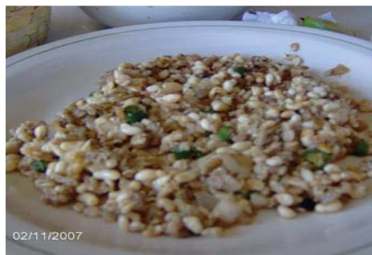
Figura 14. Escamoles guisados a la mantequilla.