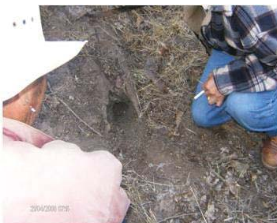
Figura 5. Orificio de entrada del nido escamolero