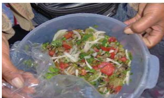
Figura 47. Caracoles a la mexicana.