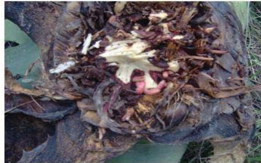
Figura 35. Raíz de maguey con chinicuiles.