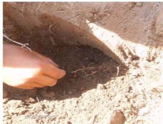
Figura 19. Vinguinos fuera de la galera para ser recogidos

en su estado natural y muchas veces recién sacadas del hormiguero para así evitar que se rompan por la irradiación del sol o durante el traslado hacia algún punto de venta.