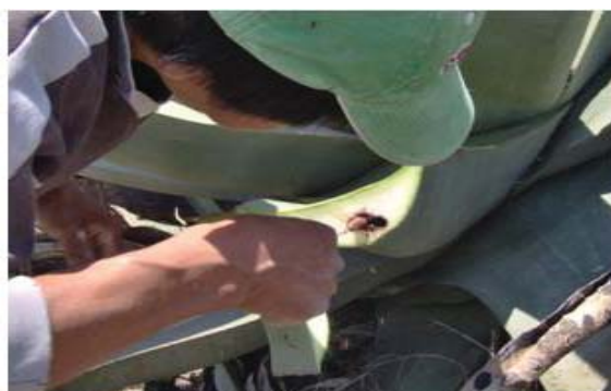
Figura 27. Recolector sacando el gusano de la penca.