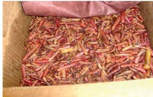
Figura 37. Chinicuiles fritos y conservados con sal.