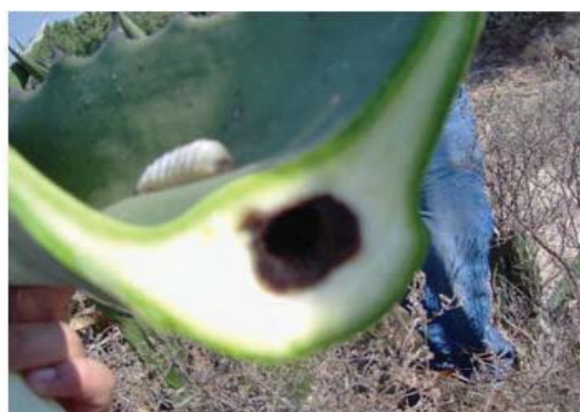
Figura 22. Penca barrenada en su interior por el gusano blanco.