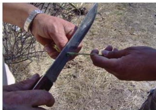
Figura 26. Elaboración del gancho con una vara seca y una espina del maguey.