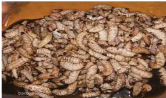
Figura 28. Gusanos frescos conservados en su "caldo".

Comercialización. Regularmente la venta de estos productos se realiza en algunos restaurantes situados afuera de la zona arqueológica de Teotihuacán o bien sobre la carretera México-Tulancingo. Los precios de cada platillo varían dependiendo de los ingredientes que se utilizan para la elaboración de los mismos. El precio de los gusanos crudos o vivos dentro de la temporada es de $600 a $700 por litro dependiendo de la disponibilidad de los mismos; fuera de temporada el precio se eleva hasta los $1,000 ó $1,200.