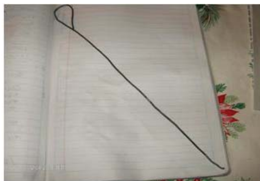
Figura 25. Gancho de alambre para sacar los gusanos.