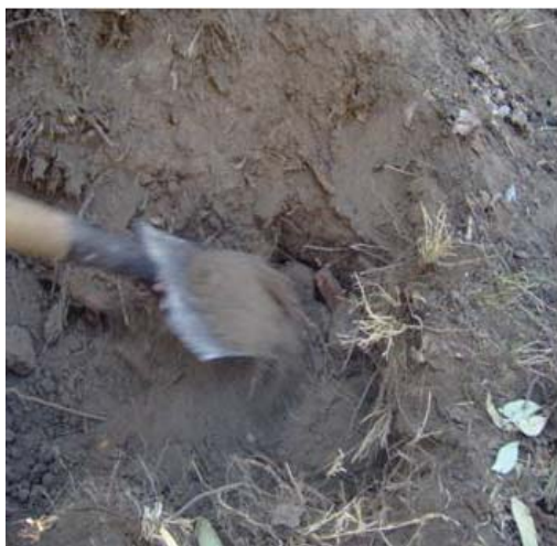
Figura 9. Tapando el nido

Comercialización. Los escamoles son muy populares, no sólo entre los lugareños sino también entre los turistas que acuden a la zona arqueológica de Teotihuacán, como parte obligada de la visita a las pirámides. Los precios de cada platillo varían dependiendo de los ingredientes que se utilizan. Por ejemplo, los escamoles naturales o crudos tienen un precio de $600 (pesos mexicanos) por cada litro (medida que los comerciantes nombran a los vasos de kilogramo) dentro de la temporada, fuera de ella el precio se eleva