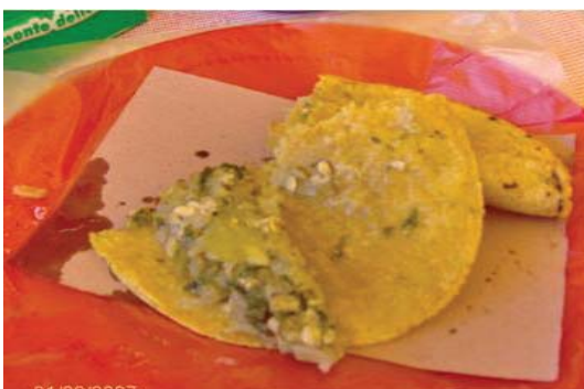
Figura 15. Quesadilla de escamol.