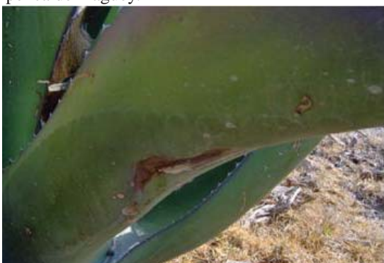
Figura 23. Penca con marca del gusano por fuera.