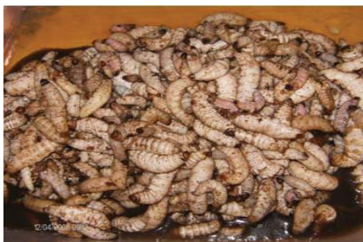
Figura 20. Gusanos blancos del maguey.

Formas de recolección. La temporada en la que es más fácil la extracción de este