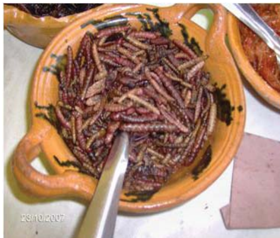
Figura 40. Chinicuiles fritos para taco.