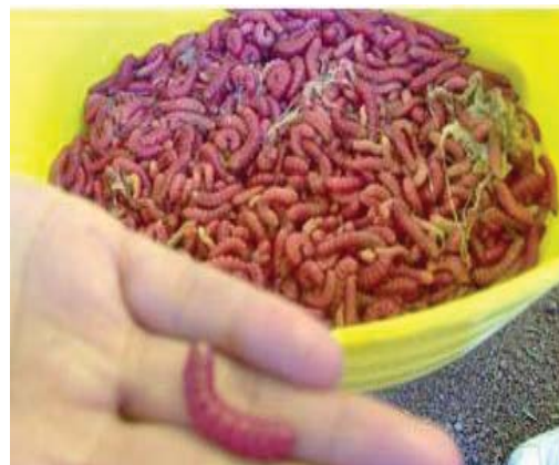
Figura 31. Gusanos rojos de maguey vivos.

Una vez localizado el maguey se procede a inclinar al maguey y sacarlo completamente (Figura 34), de esta manera las raíces del maguey, quedan expuestas al aire, y con ayuda de un machete se corta la base y tronco de la planta permitiendo la salida de los insectos (Figura 35). Luego, con la ayuda de un gancho de metal o con la punta de una penca de maguey se extraen los gusanos y se colocan en un