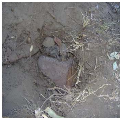
Figura 10. Nido tapado