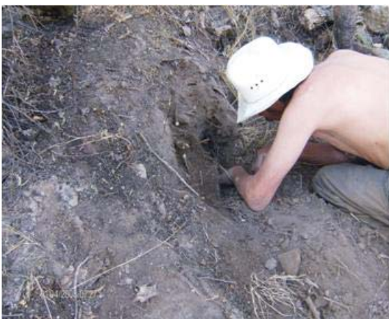
Figura 7. Escamolero extrayendo el nido

Después de terminar la extracción de los escamoles, el nido es tapado (Figuras 9-10), colocando en el interior pencas de nopal o de maguey secas, pasto seco y hierba