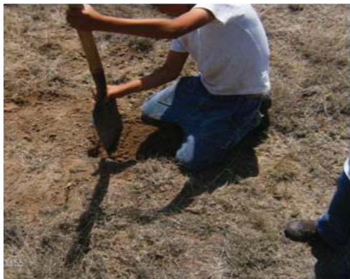
Figura 18. Niños excavando la entrada del hormiguero.