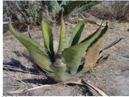
Figura 33. Maguey con pencas pintadas de rojo y curvas, indica que el maguey contiene chinicuiles.