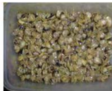
Figura 46. caracoles limpios.