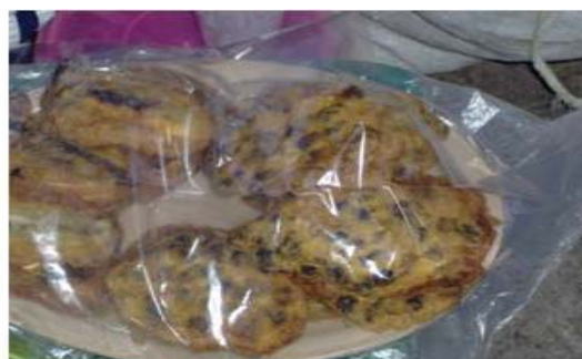
Figura 48. Tortitas de caracol.

forma natural su materia fecal. Posteriormente, se extraen con cuidado de la concha con ayuda de un gancho o de un palillo. Finalmente, se elimina completamente su aparato digestivo (ver Figura 45) para evitar sabores desagradables o amargos (ver Figura 46).