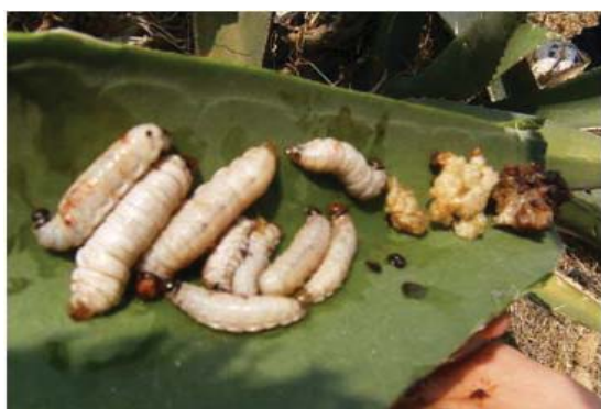
Figura 21. Gusanos blancos del maguey sobre una penca de maguey.