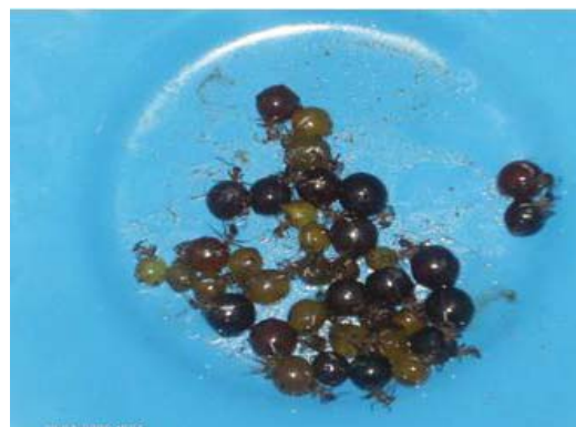
Figura 17. Vinguinos de diferentes tonalidades.

Formas de preparación. Los entrevistados refirieron no conocer forma alguna de preparación o conservación de los vinguinos. Se sugiere succionar la miel contenida en su cuerpo y devolver a la hormiga a su hábitat. Un recolector puede llegar a obtener entre 50 y 80 piezas de vinguinos por hormiguero. Los lugareños las consumen