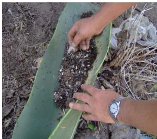
Figura 8. Penca con escamoles recién extraídos