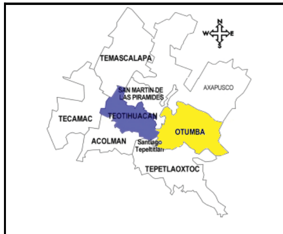
Figura 1. Mapa de la ubicación geográfica de los municipios de Teotihuacán y Otumba, México. (Fuente: Modificado de Velázquez-Vilchis, 2005 y Gómez-Aco, 2005).

El otro lugar en donde se llevó a cabo el presente estudio es Otumba, municipio que se localiza en el extremo oriente del Estado de México, entre las coordenadas máximas 19° 42' 55" latitud norte y 98° 49' 00" longitud oeste; y en las mínimas 19° 35' 37" latitud norte y 98° 38' 48" longitud oeste, a una altura de 2349.41 m.s.n.m. Limita al norte con el municipio de Axapusco; al sur con el municipio de Tepetlaotoc; al sureste con el estado de Tlaxcala; al este con estado de Hidalgo y al oeste con el municipio de San Martín de las Pirámides (ver Figura 1). Dentro de las principales actividades que se realizan en este municipio destacan: la agricultura, ganadería, industria y turismo. Particularmente en este último rubro, se cuenta con lugares propios para el desarrollo turístico como monumentos históri-