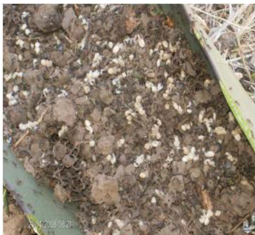
Figura 11. Escamoles recién extraídos de la escamolera, con algunas hormigas.