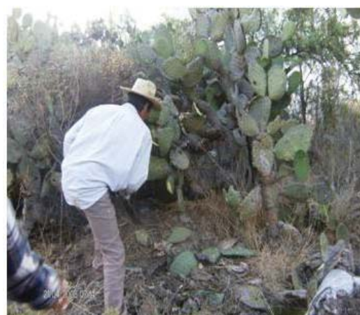
Figura 6. Nopalera donde se localizó el nido de hormigas en la investigación

Una vez que el nido es localizado (Figura 5 y 6), se remueve la tierra en dos etapas: en la primera, con ayuda de una pala se extrae la mayor parte de la tierra hasta encontrar el túnel que contiene el mayor número de hormigas, lo que indicará la dirección en la que se deberá continuar la excavación; en la segunda etapa, el escamolero continuará escarbando con las manos (Figura 7), para evitar romper el nido. Este es el momento en que se inicia la etapa más difícil del proceso de extracción, ya que las hormigas al defender su nido atacan sin piedad al extraño invasor, quien en cuestión de segundos es cubierto por cientos de hormigas que lo muerden y le causan un dolor muy particular; esta actividad requiere de mucha experiencia y capacidad para soportar el dolor generado por los piquetes de las hormigas. Posteriormente, haciendo uso de una especie de escobetilla elaborada con hojas de un árbol comúnmente llamado pirul ( Schinus molle ), se quitan cuida-