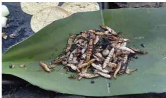
Figura 29. Gusanos de maguey asados servidos en penca de maguey.