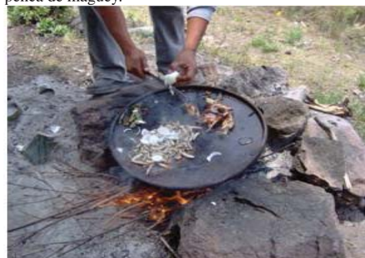
Figura 30. Preparación de gusanos con cebolla y chile.