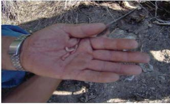
Figura 32. Chinicuiles al inicio de la temporada.