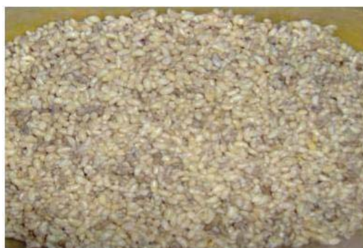
Figura 13. Escamoles frescos y limpios.