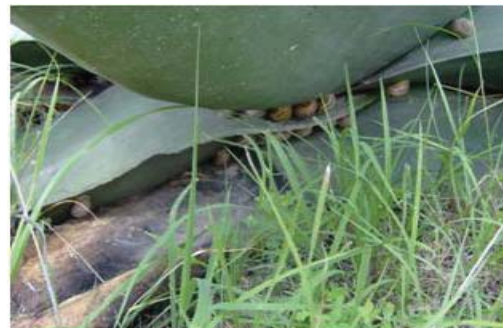
Figura 44. Caracoles debajo del maguey.