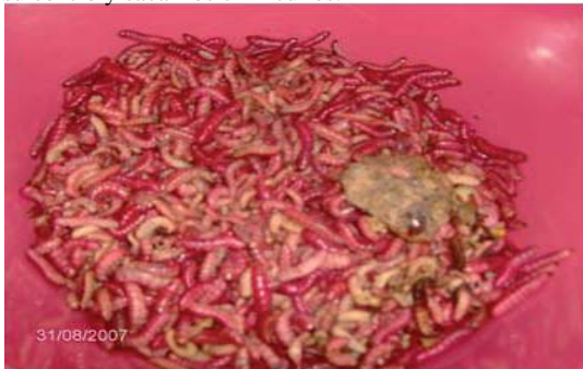
Figura 36. Chinicuiles con un trozo de piña para mantenerlos vivos.