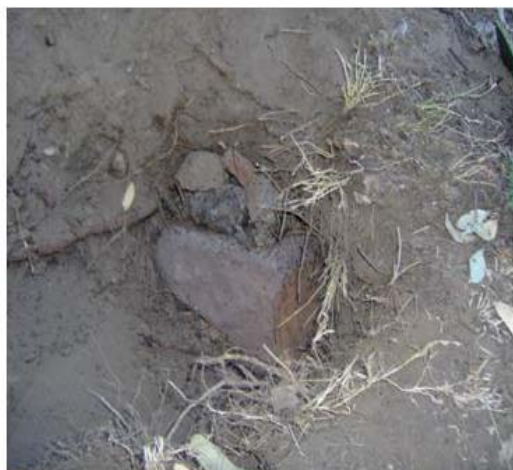
Figura 12. Nido tapado por los escamoleros para conservar en óptimas condiciones para el siguiente año.