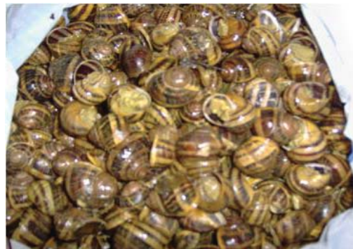
Figura 41. Caracoles frescos.

Formas de preparación. Antes de limpiarlos de forma manual y uno por uno, estos moluscos se dejan en la bolsa amarrada de dos a tres días con el fin de eliminar de