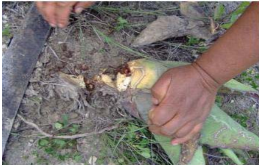
Figura 34. recolector tirando el maguey para exponer su centro y sacar los chinicuiles.