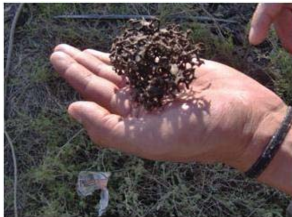
Figura 4. Fragmento de un guacal que las hormigas elaboran como nido.