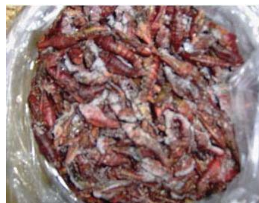
Figura 49. Chapulines congelados.

Forma de recolección. Los chapulines se reproducen todo el año y es relativamente fácil capturarlos. Las personas que se dedican a esta actividad señalan que su recolección es más fácil en la época de lluvias ya es cuando se encuentran en mayor abundancia. Después de capturarlos ya sea manualmente o con la ayuda de redes, se mantienen por al menos un día en ayuno con el fin de desechar algunas sustancias que podrían ser dañinas al organismo humano en el momento de su consumo.