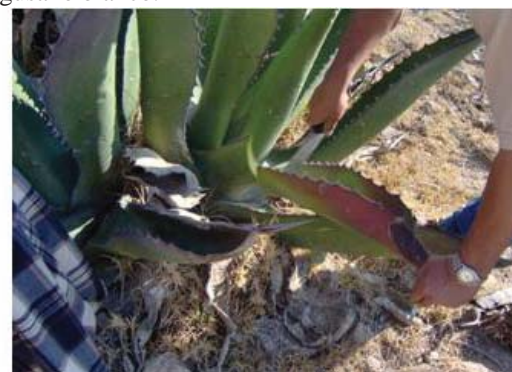
Figura 24. Recolector cortando la penca para extraer el gusano.