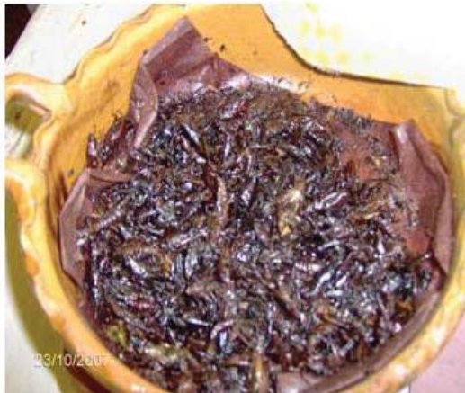
Figura 50. Chapulines fritos.

Formas de preparación. Los chapulines se pueden conservar congelados (Figura 49) o de la misma manera que los gusanos rojos, es decir se frien y se colocan en una caja de cartón cubierta de papel y almacenan en un lugar fresco y seco (Figura 50).