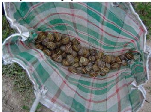
Figura 43. Caracoles en bolsa de nylon para evitar que escapen.