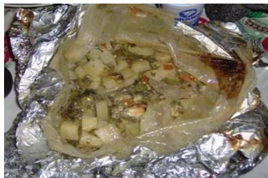
Figura 16. Mixiote de escamoles.

hasta los $800 o $900 dependiendo de la demanda y de la abundancia del producto.