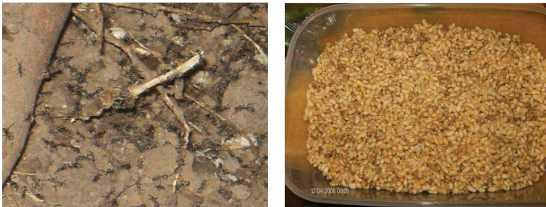
Figura 3. Izquierda: Hormigas escamoleras a la entrada de su nido. Derecha: Escamoles recién recolectados.