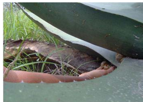
Figura 42. Recolector halando los caracoles debajo de las pencas del maguey