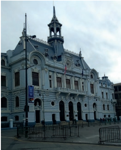
Imagen 2: Valparaíso histórico

nuevos turistas y promocionando los valiosos atractivos paisajísticos y culturales de Chile. Cabe destacar por otra parte, que según el último anuario publicado por SERNATUR (Servicio Nacional de Turismo de Chile) en 2017 el número de turistas internacionales fue de 5.239.950, habiendo pernoctado el año anterior en Valparaíso 712.169 turistas, o sea, la ciudad recibe 2 turistas por habitante. Un dato considerable al compararlo con estadísticas de la región. Por último, incidimos en que Moreno et al. (2016) plantean la necesidad de estudiar la relación entre gastronomía, cultura y turismo en la ciudad y su entorno para proponer rutas de turismo atractivas para los visitantes.