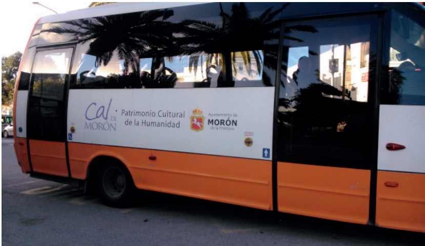
Ilustración 4: Promoción en transporte público

En relación a otras actuaciones que la Asociación realiza para la promoción del producto cabe destacar la elaboración de unos azulejos decorativos para significar obras, rehabilitaciones, y construcciones realizadas con cal de Morón. Estos azulejos contemplan dos variantes, según la aplicación del producto para blanquear o para elaborar morteros: “Encalado con Cal de Morón” y “Restaurado con Cal de Morón”. En ellos se identifica y añade el valor internacional con el lema “Patrimonio de la Humanidad” y el emblema oficial de la UNESCO. En este caso la ausencia del logo “Patrimonio Cultural Inmaterial” indica un uso incorrecto de la marca ya que según las Directrices Operativas los dos logos deben emplearse de forma conjunta (artículo 125).