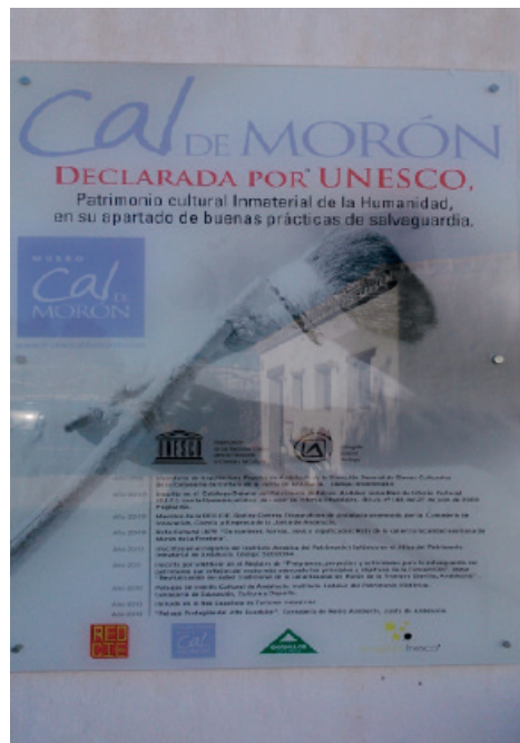
Ilustración 2: Panel con distinciones y reconocimientos obtenidos. Museo de la Cal

Esta sinergia a partir de iniciativas difusoras, formativas, educativas y empresariales, alrededor del patrimonio calero y la cultura de la cal, cristalizó en la propuesta y posterior inclusión en el Listado de Buenas Prácticas de la UNESCO en 2011, un proceso de patrimonialización impulsado por la Asociación de los Hornos con todos los avales institucionales, consentimientos de la comunidad, y adhesiones de los agentes implicados (Grupo de Desarrollo Rural “Serranía Suroeste”, Asociación Proyecto Fresco, Red de Centros de Interpretación Etnográfica de Andalucía –Red CIE-, Red de Recuperación de Oficios Artesanos en Peligro de Extinción -Red ROAPE-, y la Asociación Nacional de Fabricantes de Cales, entre otros). Con la distinción UNESCO se reconoce una labor de sensibilización y recuperación de un patrimonio inmaterial en los términos del artículo 18 de la Convención de 2003. A efectos formales la propuesta se inscribe en el Registro de Buenas Prácticas, donde se reúne la lista de programas, proyectos y actividades que mejor representan los principios y objetivos de la Convención.