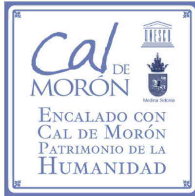
Ilustración 3: Azulejo promocional de la cal de Morón para el Ayuntamiento de Medina Sidonia