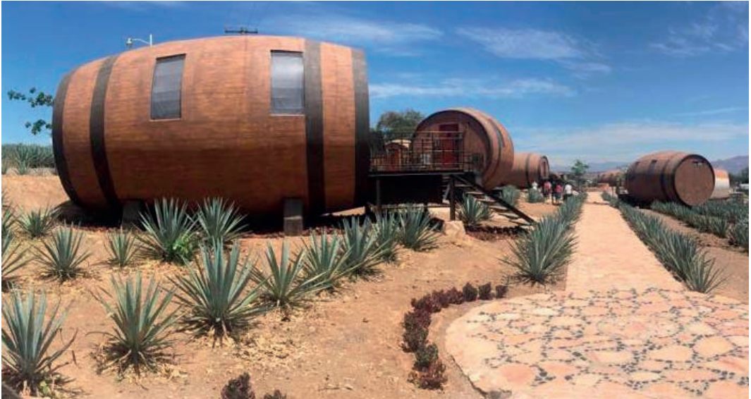
Imagen 10: Habitaciones de Matices Hotel de Barricas. Ubicado a unos cuantos metros de la casa tequilera “La Cofradía” en Tequila, Jalisco.