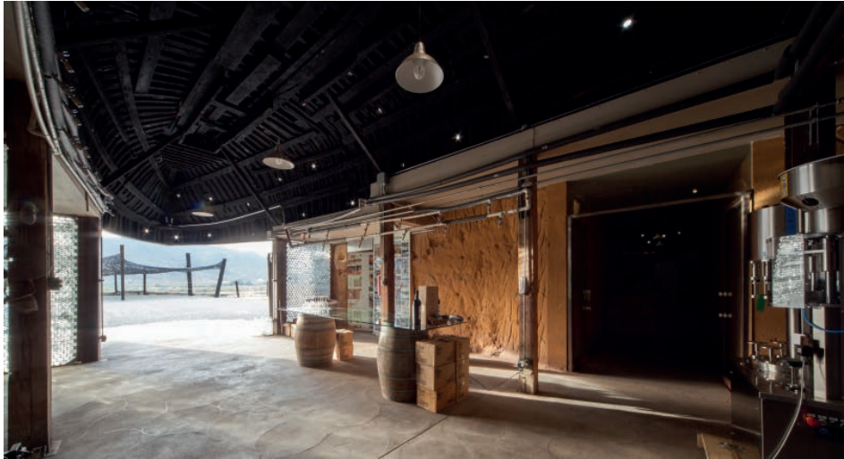
Imagen 8: Vinícola Vena Cava. Las cubiertas están compuestas por barcos reciclados que en su parte cóncava logran un interior confortable. Afuera, la cubierta de la terraza está hecha con mangueras de riego recicladas y trenzadas.