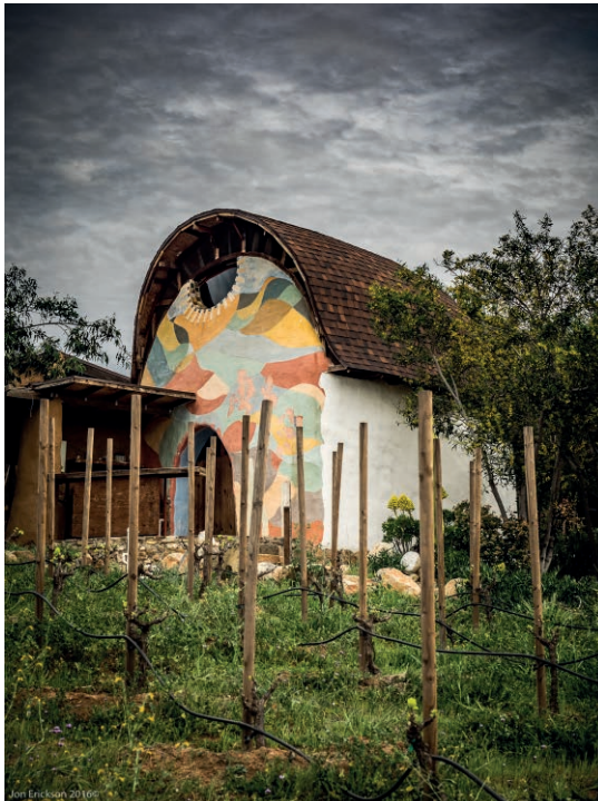
Imagen 9: (derecha) Vinícola Sol y Barro, construida por el propio dueño con sistema COB (arcilla, tierra y paja) con la que contaba en su propiedad.