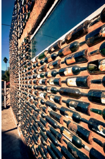
Imagen 6: Muro de block con revestimiento de botellas de vino ahogadas en concreto entintado.