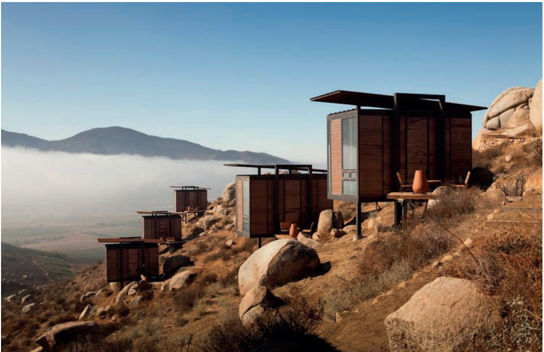
Imagen 11: Habitaciones del Hotel Endémico, en Encuentro Guadalupe dentro del Valle de Guadalupe en Baja California.