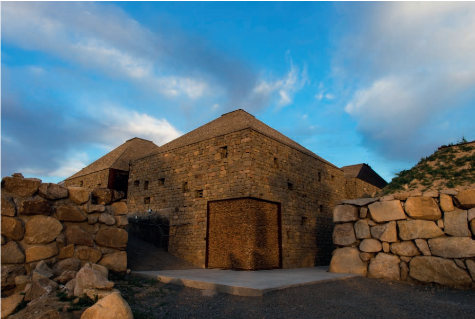
Imagen 7: Vinícola Clos de Tres Cantos, construida con piedra extraída de la región, madera y botellas recicladas en puertas y ventanas.