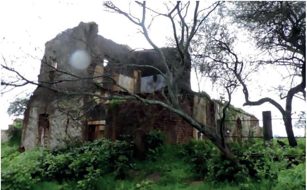
Imagen 3: Restaurante subterráneo que imita una antigua taberna en la casa tequilera “La Cofradía” en Tequila, Jalisco.

Las intervenciones tanto urbanas como arquitectónicas en esta nueva faceta turística de un pueblo dedicado durante toda su existencia a la fabricación de vino de mezcal, priorizan el flujo del turismo, a la vez que revisten de una arquitectura concertada las fachadas de las vías principales y más visibles ante la mirada ajena. En el pueblo “se ha construido nuevas edificaciones que recuperan el valor contextual de la arquitectura del siglo XVII y XVIII vinculada con la figura de la hacienda tequilera” (González, 2010, p. 273). Al mismo tiempo que, conforme proliferan nuevas Casas Tequileras en la región, se pueden encontrar edificaciones recientes que replican la tipología de la hacienda 4 . Incluso se ha llegado a edificar una reproducción de una taberna completamente subterránea, lo cual ha despertado el interés del turismo y ha posicionado a esa casa tequilera 5 dentro de las más visitadas. En cambio la arquitectura patrimonial o auténtica de los siglos XVI al XIX destinada a la producción, almacenaje y consumo del tequila está prácticamente abandonada. Para los propietarios de estas haciendas resulta más sencillo y económico construir un edificio nuevo anexo (en la misma propiedad) que restaurar el que tienen (imágenes 3 y 4).