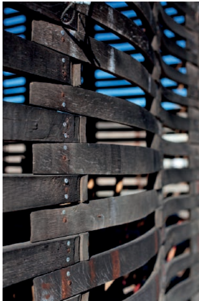
Imagen 5: Madera de barricas de vino recicladas y entramadas para formar un muro celosía.

En ese contexto tiene inicio una paulatina regionalización y un cambio de velocidad en cuanto a la producción y la manera de concebir el consumo del vino. Con la llegada del enólogo Hugo D’Acosta, Santo Tomás cambia su producción de medio millón a tan solo 135 mil botellas al año, mientras que Monte Xanic incursiona en la particularización del Valle de Guadalupe como región vinícola y potencia la producción de vinos de boutique (de guarda), es decir, la producción comienza a orientarse hacia el vino de mayor calidad y en menor volumen.