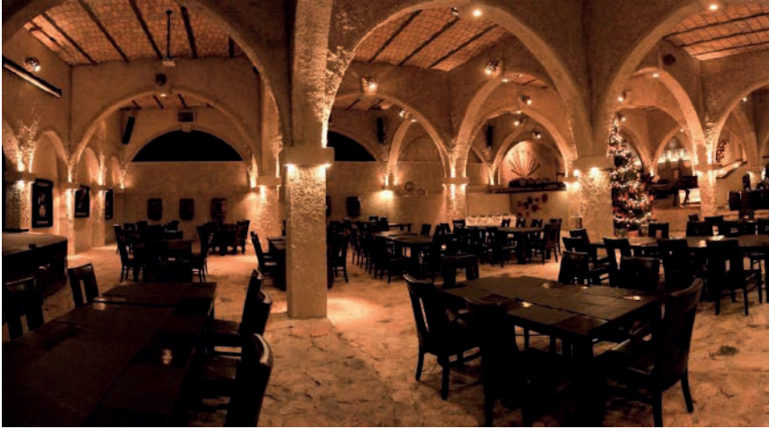
Imagen 4: Ruinas de la antigua Hacienda La Cofradía en Amatitán, Jalisco.