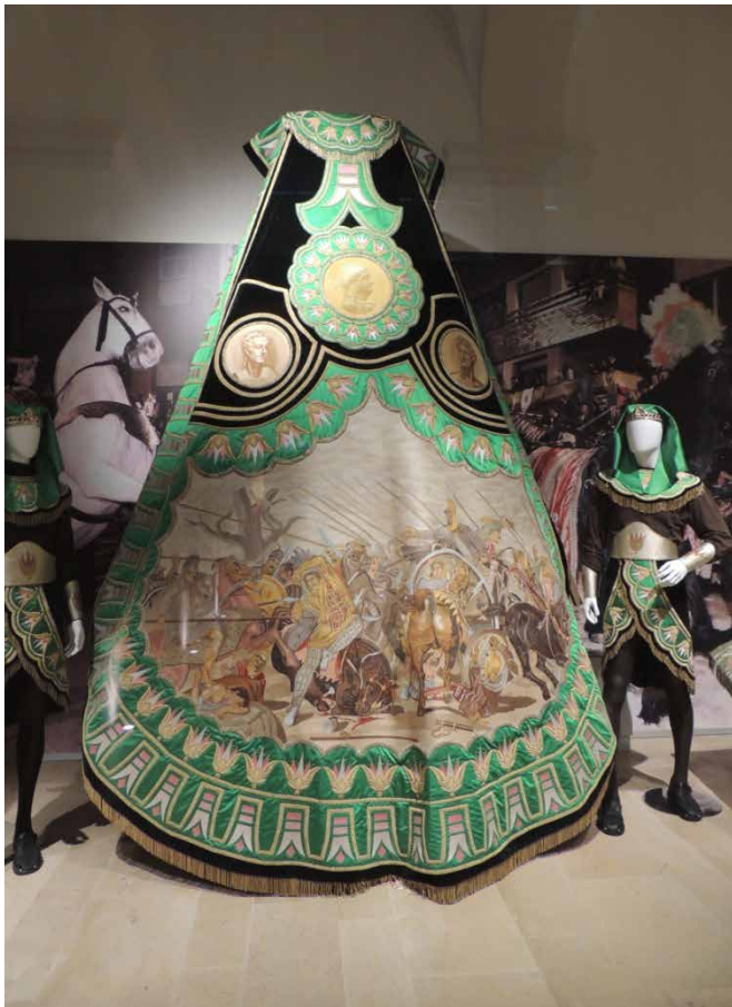
Autora: M a Ángeles López de los Mozos.

Los bordados en seda son también una característica destacada del patrimonio lorquino. La Semana Santa de Lorca se organiza en torno a seis cofradías, llamadas “Pasos”.